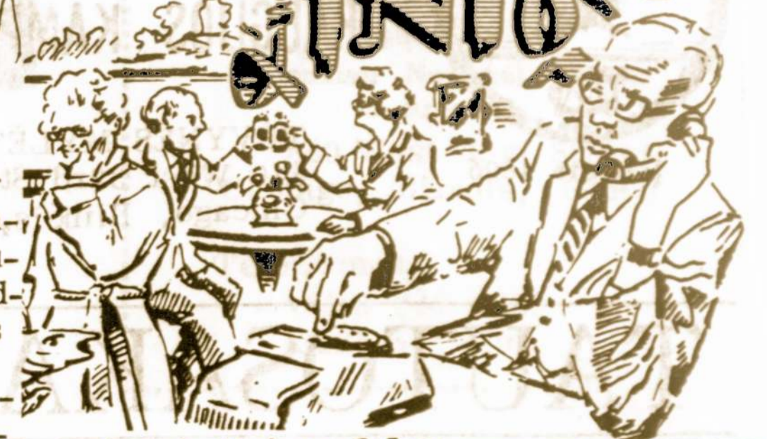
Redaguoja Vaclovas Prūsas

Gal svarbiausia ir prisimintina, tai 1975 m. vasario 16-tos proga buvo su-