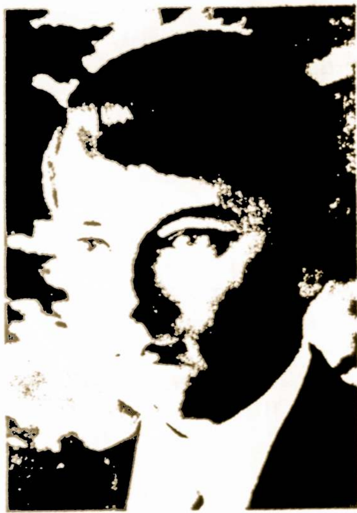
Romas Kalanta, a 19 year old Lithuanian student, who on May 14, 1972 self-immolated in a park in Kaunas in protest against the suppression of Lithuanian national and religious rights under the communist regime of the Soviet Union. He died in flames shouting freedom for enslaved Lithuania.

distant regions of northern and central Siberia, where majority of them perished in slave labor camps from starvation, frost, diseases, brutal maltreatment or direct executions.