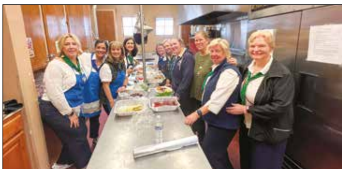
|| Gražiniečių būrelis ruošia skanius pietus