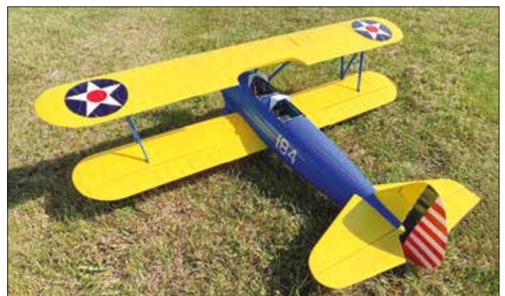
|| PT-17 Kaydet built by oro skautas Paulius Lukas in 2021.