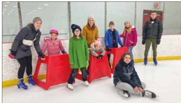
|| Čiuožimas 2023 - visi su tėveliais