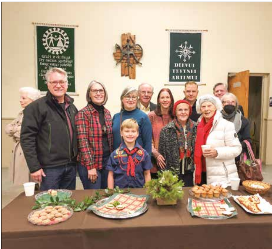
|| Dalis Hartfordo skautų ruošia kavutę bažnyčios parapijiečiams.