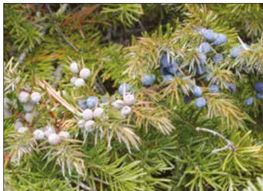
|| Common juniper (Juniperus communis) "berries"