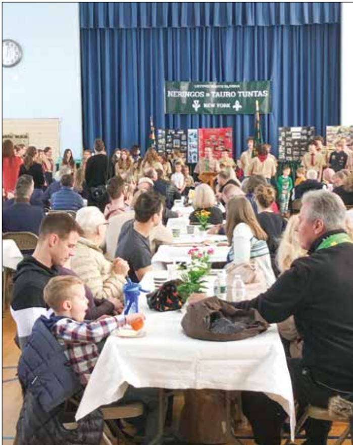
|| Mugės atidarymas