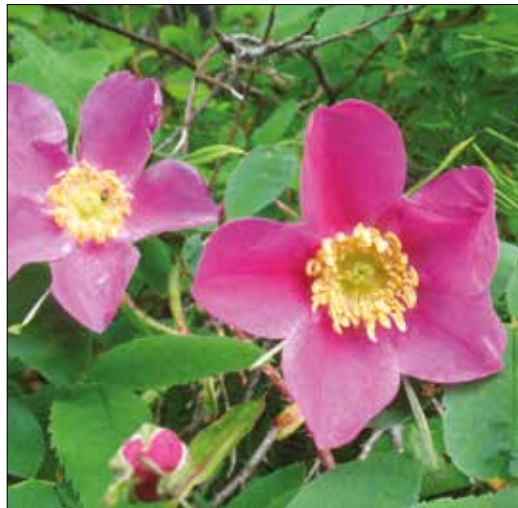
|| Wild rose flowers and rose hips (Rosa)