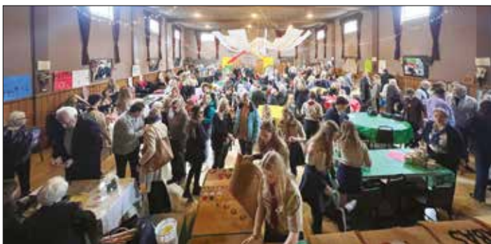
|| Mugės svečiai, dalyviai ir skautai