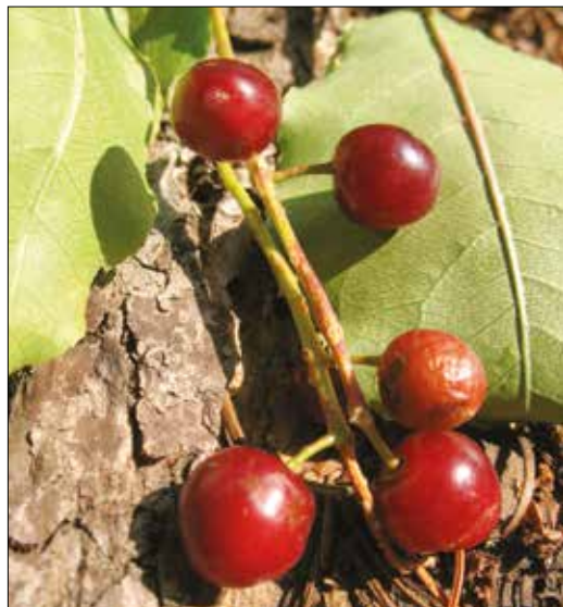
|| Chokecherry (Prunus)

to Lithuania by the 16th century. The plant has been used for centuries against various ailments. Rue extract contains bioactive compounds that "significantly interfere with the survival and proliferation of cancer cells, warranting further investigations." Although it has potential for treatment of disease, additional studies are needed regarding its safety and toxicology. Rue and plants such as grapefruit, parsley, and celery, contain phytochemicals that can cause phytophotodermatitis.