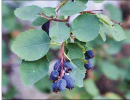
|| Serviceberry (Amelanchier)

Native to the Balkan peninsula, common rue ( ruta ) was introduced