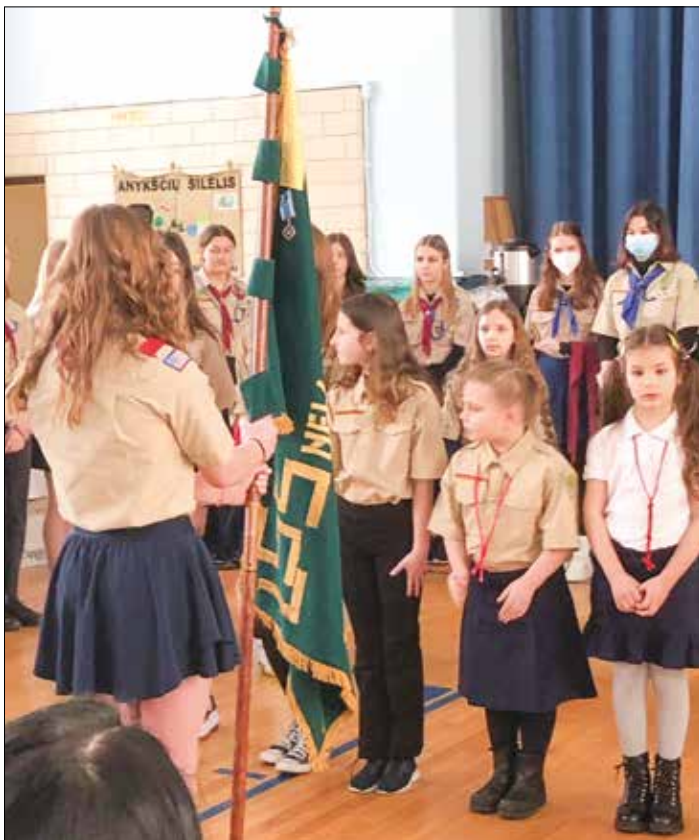
|| Paukštytės įžodis