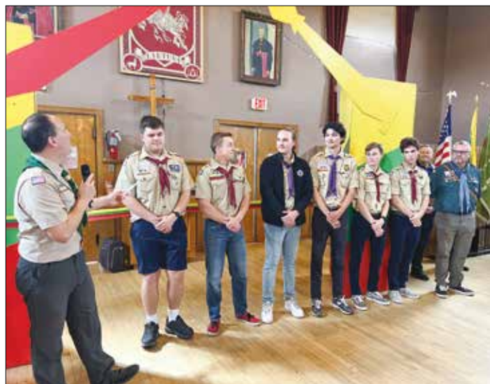
|| Mugės atidarymas ir apdovanojimai