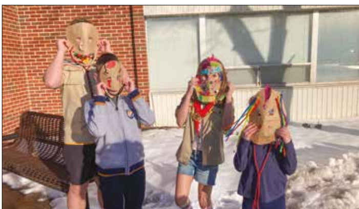
|| Užgavėnės 2023