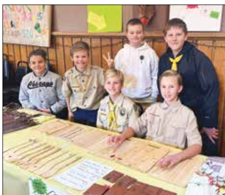
|| Kalniškių tunto broliai