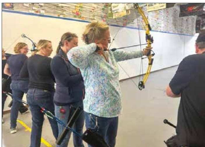
|| Sesės šaudo