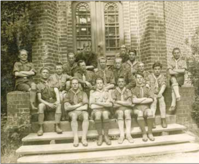
Lapinių draugovė ant Birutės kalno Palanga 1929.VII.21