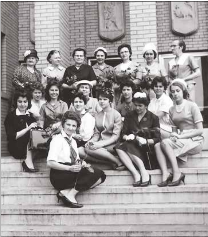
1961 m. Jaunimo Centre „Aušros Vartų“ tunto vyr. skaučių „Gabijos“ draugovė