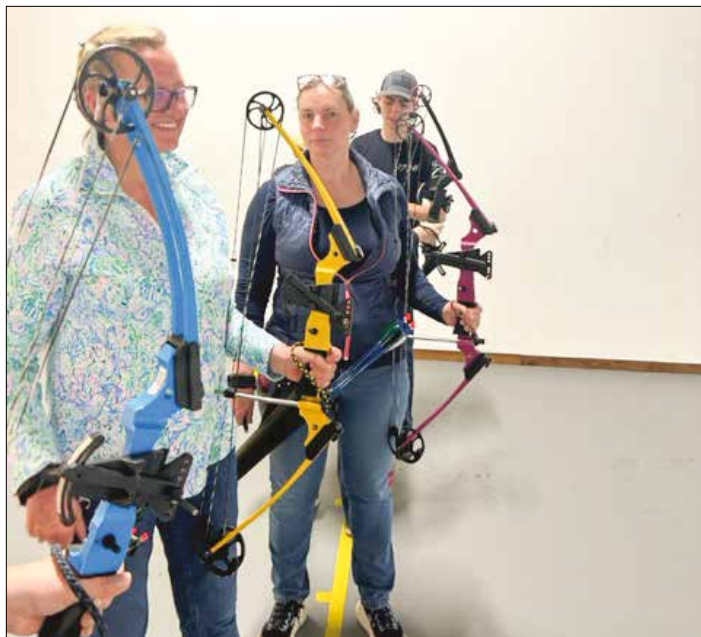
|| Sesės Sanda ir Hope