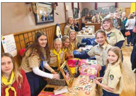
|| Palangos Tunto sesės