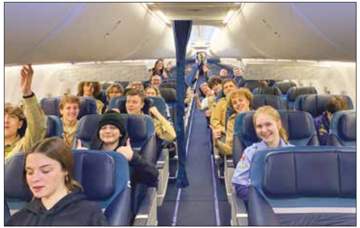
|| Kaip patogiu lėktuve (kai nėra kitų žmonių)