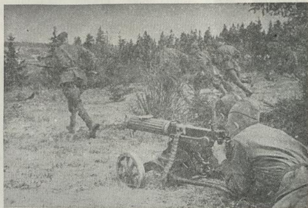
Lietuviškojo Junginio kovūnai, po apsauga mašininės kanuolės ugnies puola vokiečius.