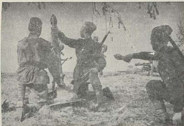
Raudonosios Armijos Lietuviškojo Junginio mortiriniai kanuolininkai gelbsti infanterijos atakai ant vokiečių.