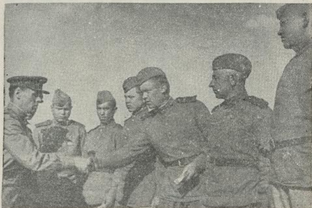
Drąsiejį Lietuviško Junginio kovūnai apdovanojami ordiniais ir medaliais.