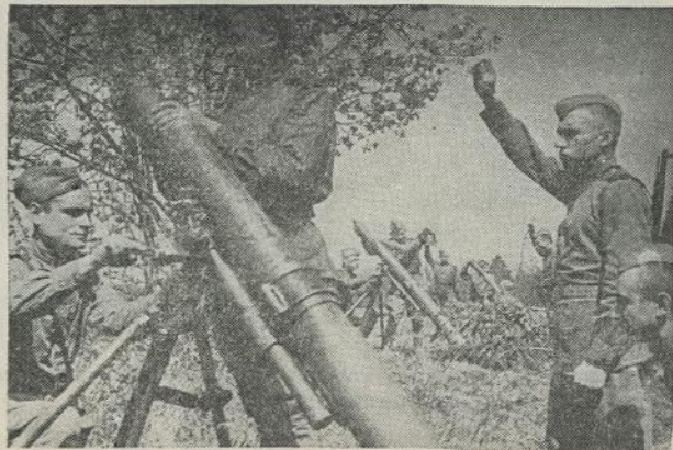
Vyresniojo Leitenanto Reišio vadovybėje mortirinė baterija.