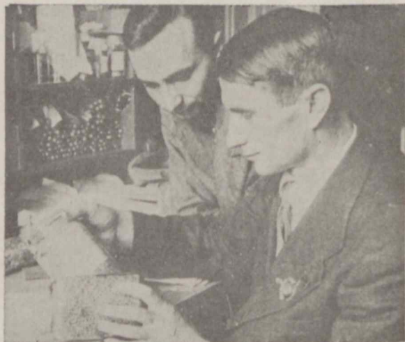
Akademikas Trofim Lisenko apžiūrinėja naujas grūdų sėklas.

Paskambinęs varpeliu, suvažiavimo pirminkas kreipėsi į delegatus.