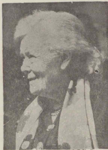
Ella Reeve Bloor

“Apsistodavau mainierių namuose, pasikalbėti su jų moterimis. Narsiai jos užsilaikydavo, nesiskųsdavo, nors veik badavo. Joms teikdavo drąsos žinojimas, jog aš visomis išgalėmis darbuojuosi sukelti pinigų jų paramai. Paprastai bute būdavo viena lova, skersai kurią gulėdavo visa šeima, apsirengę, kad nesu-