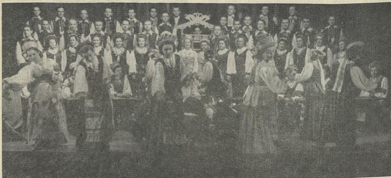
Lietuvos liaudies dainų ir šokių ansamblio atliekamas liaudies vaidinimas "Dobilėlis"