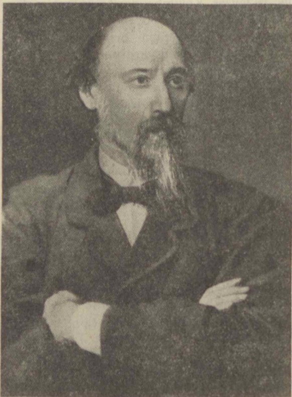
N. A. NEKRASOVAS

Jis kūrė tuo metu, kai Rusijoje pradėjo vystytis 19-to amžiaus 60—70-ųjų metų revoliucinės idėjos, kai pradėjo braškėti baudžiavinės santvarkos pagrindai. 19-to šimtmečio 60-aisiais metais Nekrasovas kaip poetas revoliucionierius stovėjo literatūrinės kovos priešakyje. Apie 20 metų jis redagavo pažan-