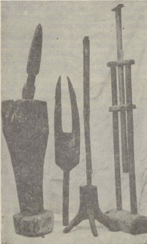
Namų apyvokos daiktai, kuriuos iki praėito šimtmečio pabaigos naudojo žmonės

Tvarkingai išdėlioti ant stalų gargažiai —