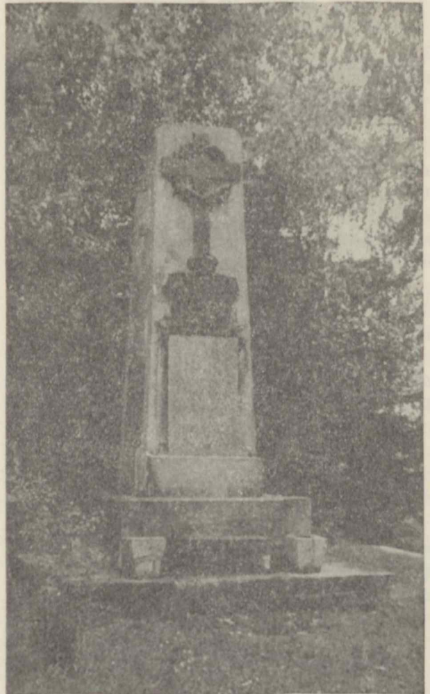
Paminklas sukilėliams, 1863 m. žuvusiems kovoje už išsivadavimą iš baudžiavinės priespaudos

Seniai nugarmėjo į praeitį baudžiavos laikai, dvarininkai ir bajorai. O kas čia? Gi "bajorystės teisių raštas". Jis, o taip pat daugybė medinių gamybos priemonių bei na-