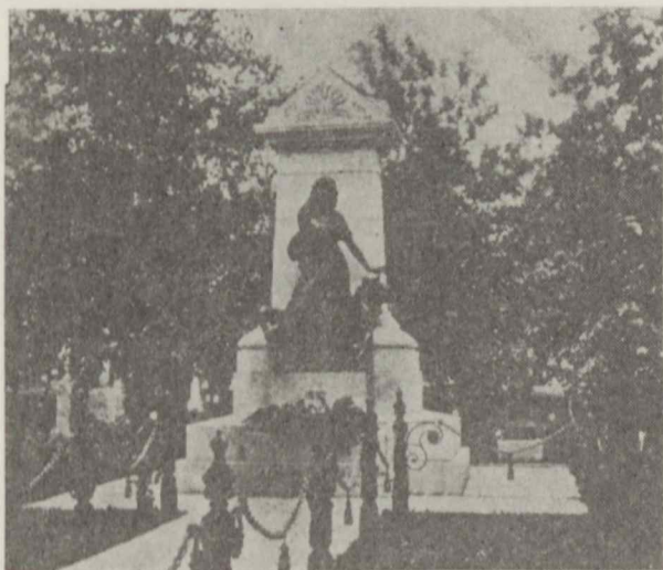
Chicagoje Waldheim kapinėse keturiems darbininkų judėjimo kankiniams paminklas

Prieš apie devyniasdešimt penkerius metus, tuoj po Pilietinio karo, JAV darbininkai pradėjo kovą už trumpesnę darbo dieną. Šiandien kai jau beveik visur industriniuose kraštuose veikia aštuonių valandų darbo diena, daugeliui gali atrodyti, kad tai buvo pasiekta be didžiulių pastangų, be