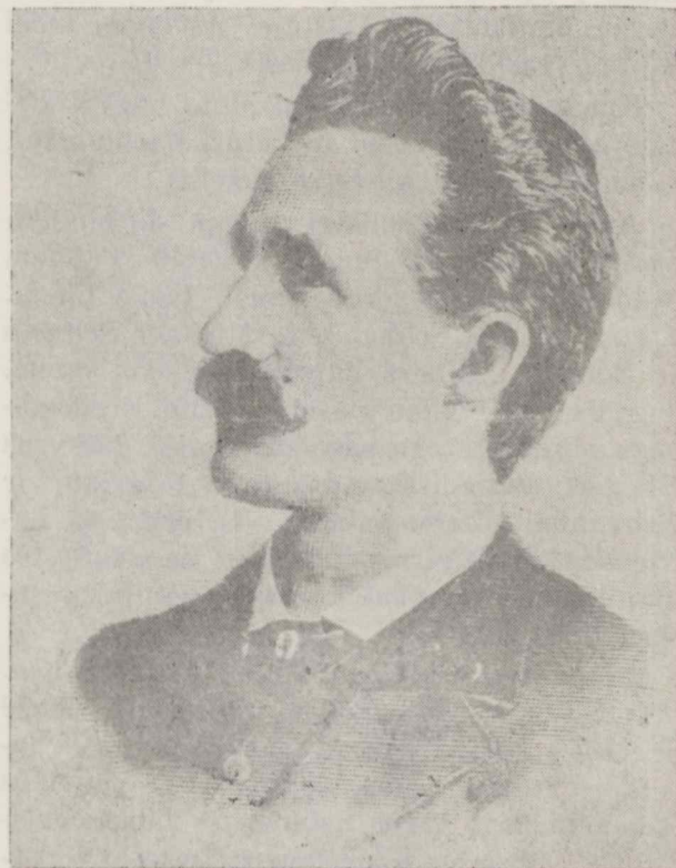
August Vincenz Theodor Spies

Tiesa, streikas buvo tik dalinai laimėtas, bet kaip tik šitas didelis darbininkų solidarumas iššaukė baisų buržuazijos kerštą prieš kovingiausias to judėjimo dalyvius. Pats aštriausias susikirtimas įvyko didžiajame Amerikos industriniame centre — Čikagoje. Kaip tik Čikagoje plačiausiai išsivystė kova dėl aštuonių valandų, kaip tik Čikagoje