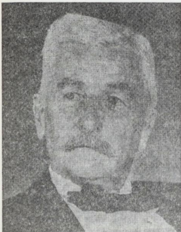
William Faulkner (1897-1962)

Viljamas Folkneris buvo tipiškas JAV pietietis, kilęs iš senos feodalinių aristokratų šeimos. Mokslo jis buvo menko—nebai-