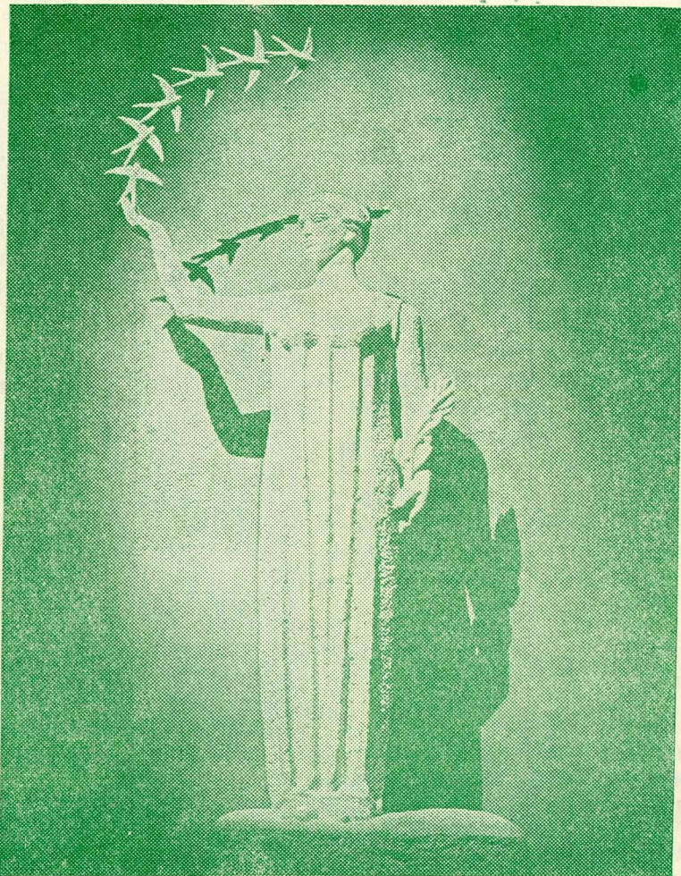
Juozo Mikėno skulptūrinė grupė "Pirmosios kregždės."