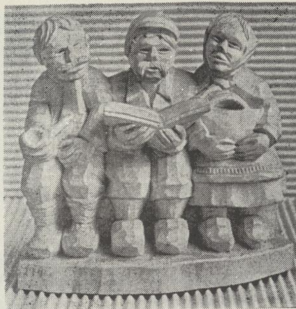
“SKAITO KNYGĄ” – J. Lukauskas