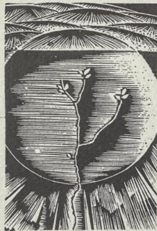
ILIUSTRACIJA. V. Žilnius

Mergaitės aš daugiau nesutikau. Jos tėvą areštavo, o ji su motina kažkur išvažiavo.