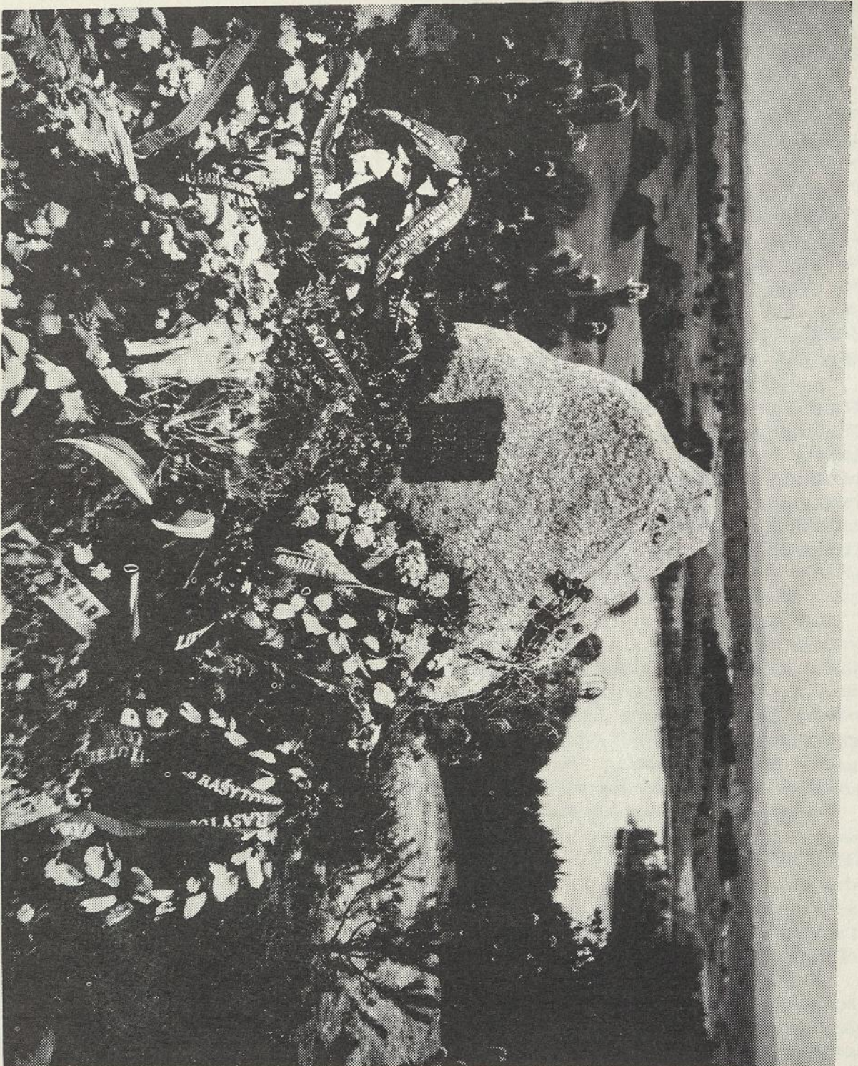
ROJAUS MIZAROS KAPAS SAVULIONYSE.