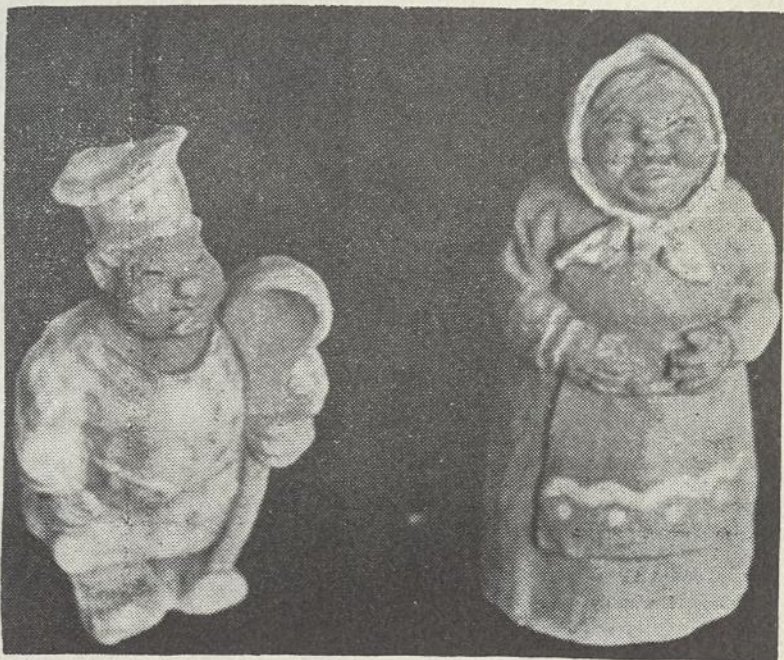
“VIRĖJAS SU ŠEIMININKE - I. Rutkauskaitė.