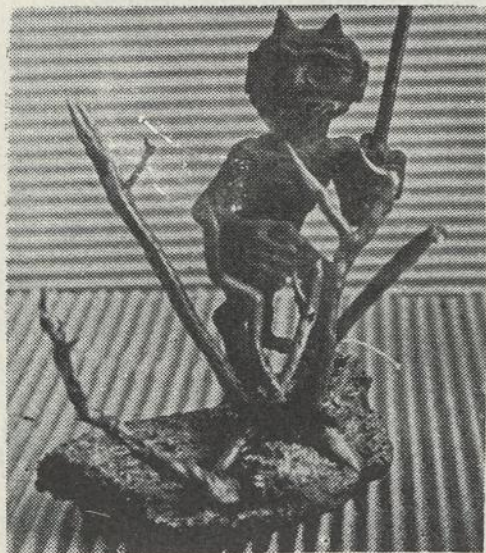
“LIUCIPIERIUS” - A. Kazlauskas.