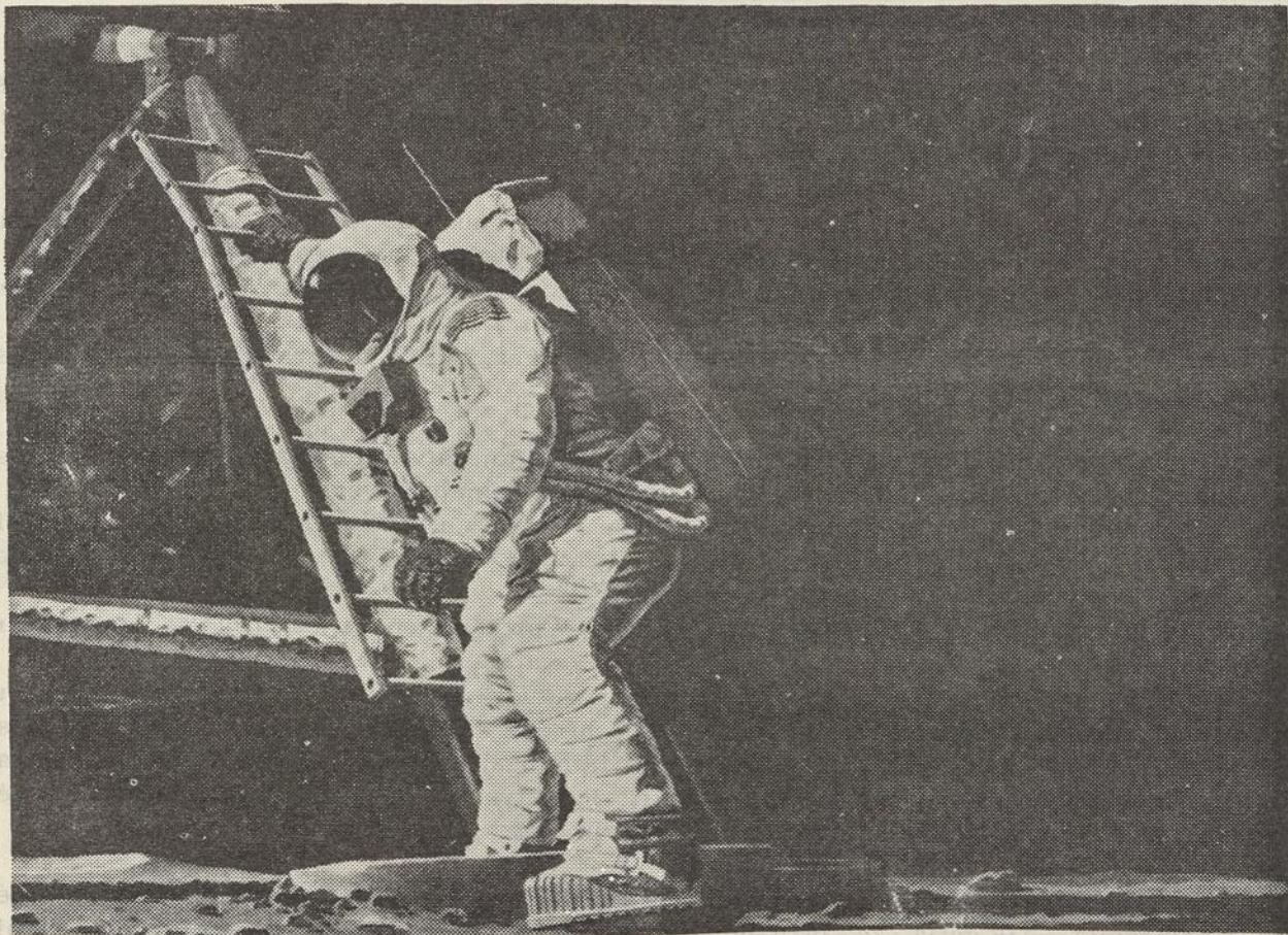
PIRMĄ KARTĄ ISTORIJOJE ŽMOGUS MĖNULIO PAVIRŠIUJE.