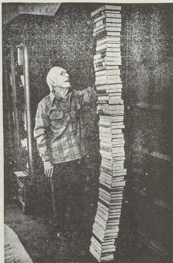
Rašytojas Upton Sinclair ir jo parašytos knygos,

Eptonas Sinkleris ne visada buvo nuoseklus. Jis nė karto nebuvo Tarybų Sąjungoje ir todėl ne visada galėjo teisingai suprasti pir-