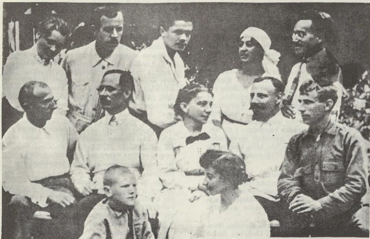
V. Kapsukas tarp poilsiautojų Rygos pajūryje 1921 metų rugpiūčio mėnesį. Greta jo sėdi V. Lenino sesuo Ana Uljanova - Jelizarova.

„Leninas, — toliau skaitome V. Kapsuko straipsnyje, — pats nedalyvavo toje konferencijoje. Kuomet aš sugrįžau Krokuvon (aš tuomet irgi ten apsigyvenau, pabėgęs iš Sibiro), tuojau gavau telegramą, kviečiančią važiuoti pas drg. Leniną į Poronino kaimą, kur jis vasarai persikraustė gyventi (ties Karpatais). Nelaukdamas nuvažiavau. Pakvietimo tikslas buvo išaiškinti, kad iš to Briuselio susituokimo su menševikais nieko neišeis, kad menševikai visuomet liks menševikais ir t. t. Lenkijos socialdemokratų opozicijos atstovai jau sutiko su tais įrodymais ir atsisakė nuo