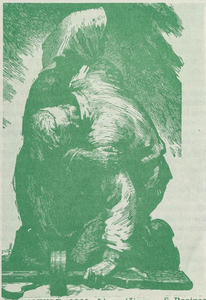
MOTULE. 1960. Linoraižinys.- S. Rozinas