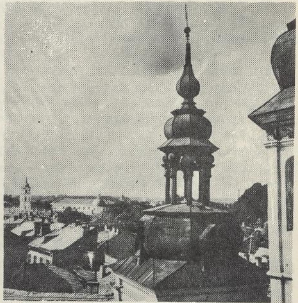
VILNIAUS BOKŠTAIS NEGALI ATSIŽAVĖTI

O šiandien ir aš pasiilgęs atvykau į Vilnių, kaip atvyksta pavargęs keleivis į savo tėviškę. . . Daug meilės atsinešiau savo širdy, bėgalinio ilgesio, kad akys Vilniaus bokštais negali atsižavėti.