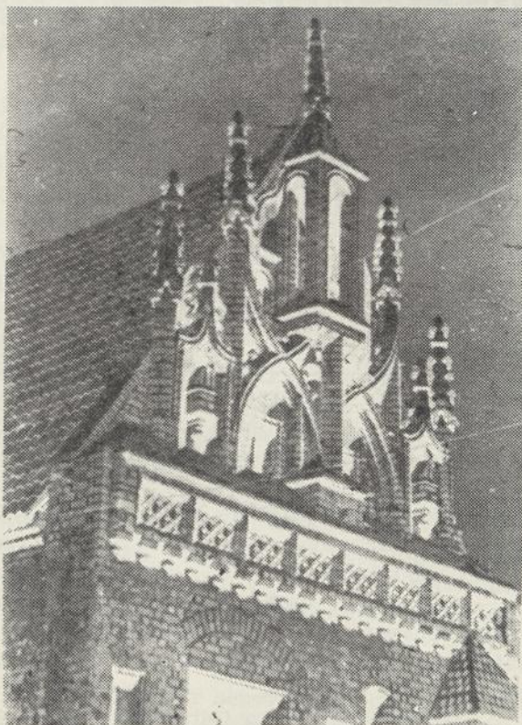
“PERKŪNO” NAMAS KAUNE. XVI a.