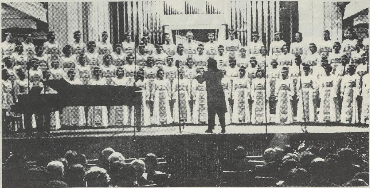
LIETUVOS LENGVOSIOS PRAMONĖS MINISTERIJOS PAVYZDINIO MOTERŲ CHORO "AIDAS" ataskaitinis koncertas VILNIUJE