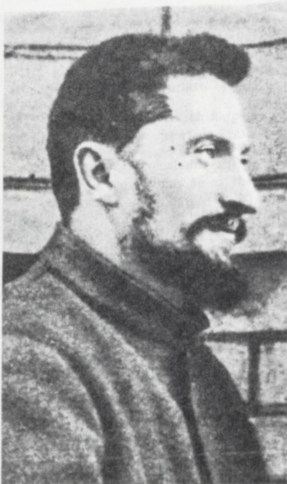
Zigmas Angarietis, 1909 metai