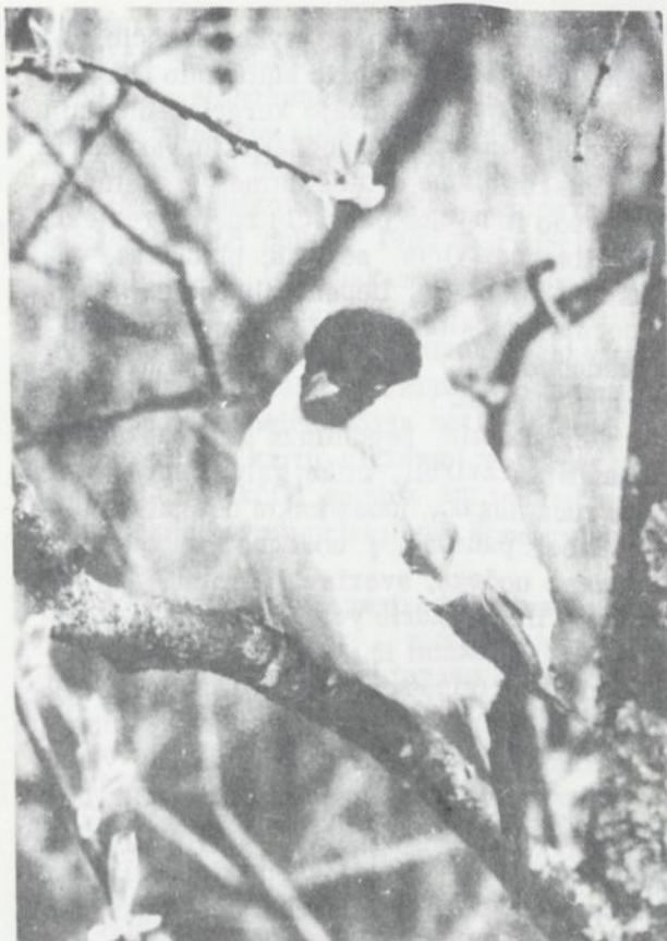
Juodagalvė Sniegena pilkame gluosnyje

Paukščiai ne tik mus linksmina ir maloniai nuteikia, bet jie turi labai didelę reikšmę ir žmogaus gerovei. Juk viena kregždė per metus sunaikina nuo pusės iki 1 milijono vabzdžių, gegutė per valandą sulesia iki 100 plaukuotų vikšrų, pelėda per metus sunaikina tiek pelių, kurios suėstų toną grūdų, o varnėnų šeima per dieną sunaikina daugiau kaip 350 įvairių vabzdžių.