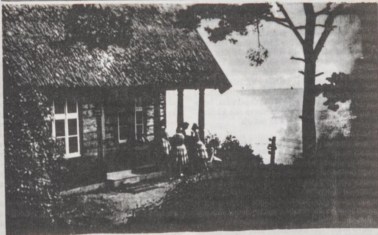
P r i e g i n t a r o j ū r o s

“Mano gintarinė Pasaka” - taip apibūdina poetas mokinys savo mylimą poetę mokytoją.