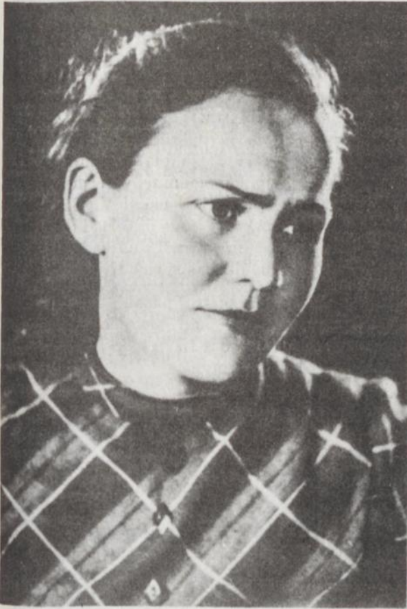
Lietuvių liaudies poetė SALOMEJA NERIS

Suėjo 70 metų, kai 1904 m. lapkričio 17 d. Kiršų kaime, Vilkaviškio apskrityje, gimė lietuvių liaudies poetė Salomėja Nėris (tikroji pavardė Bačinskaitė-Bučienė) - didžioji lietuvių lyrikė.