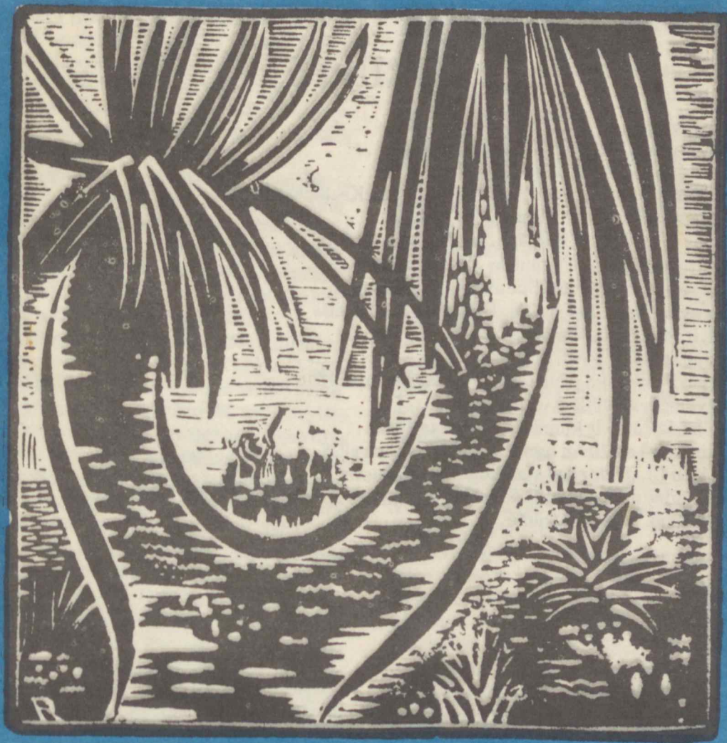
Juodosios Palmės. V. Ratas