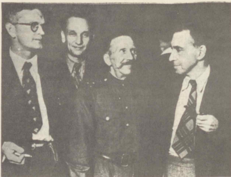
A. Venclova, J. Paleckis, L. Gira ir I. Erenburgas Maskvoje 1943 m., minint L. Giros literatūrinio darbo 36 metų sukaktį.

paukščiai, visi džiaugėsi atgijusia gamta. Poetas tarė: "Draugai, visi paukščiai džiaugiasi, čiułba, užtraukim ir mes dainą, bus daug smagiau žygiuoti".