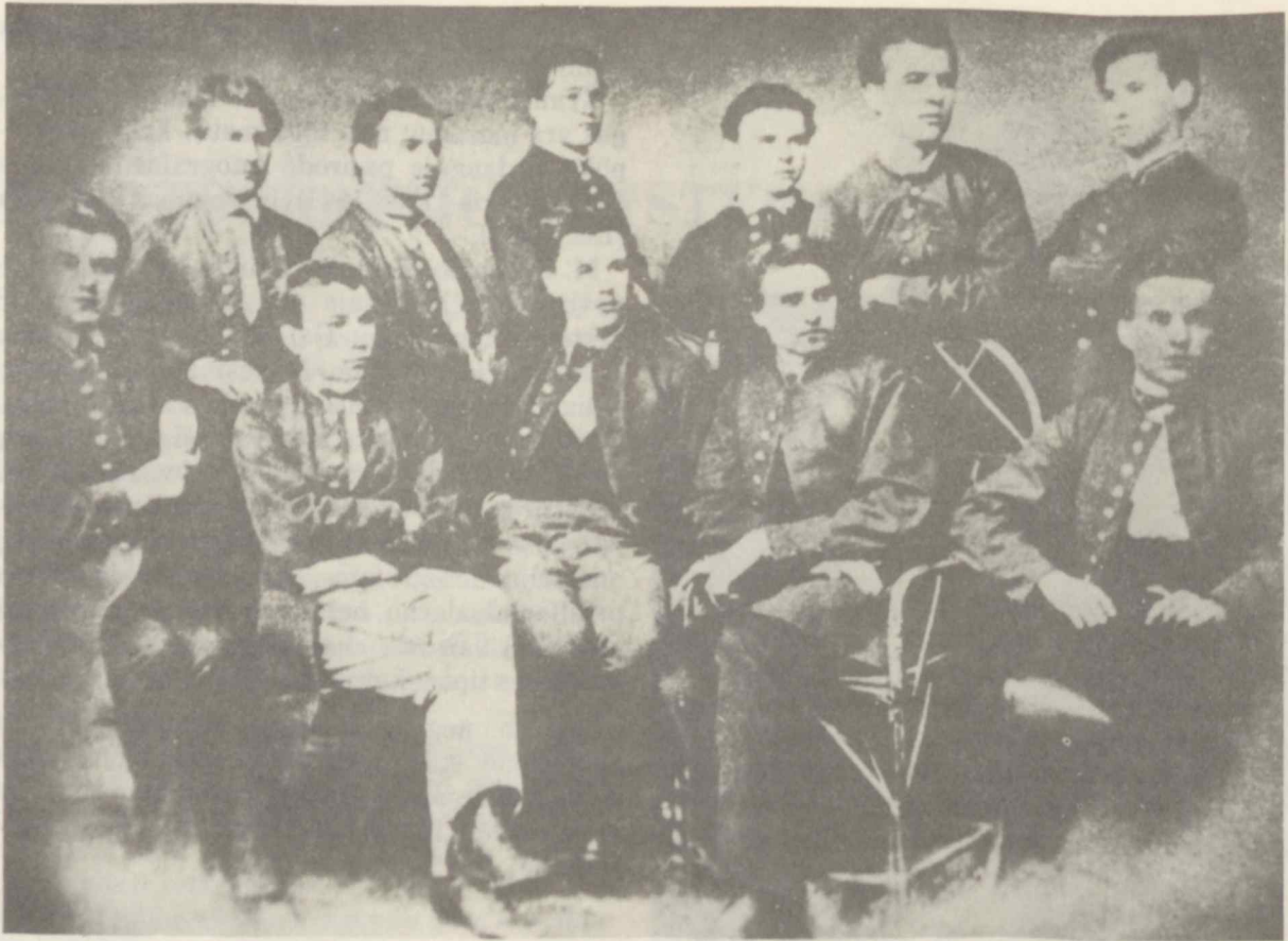
Grupė Marijampolės gimnazistų su J. Basanavičium [antras iš dešinės, sėdi] 1873 m.