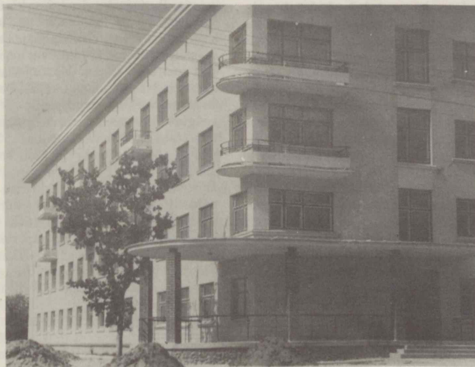
Lietuvos Ž. Ū. Akademijos studentų 4-sis bendrabutis, o tokių yra 7.