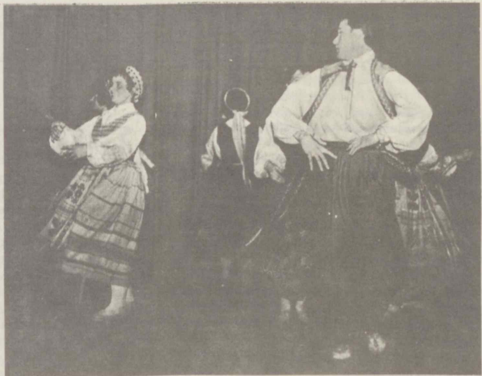
Iš L. Ž. Ū. Akademijos liaudies šokių ansam- blio. Suk, suk ratelį . . .

loje 1932 m. mokėsi tik 264 studentai, o ją baigė nuo 1924 m. iki 1940 m. tik 400 asmenų.