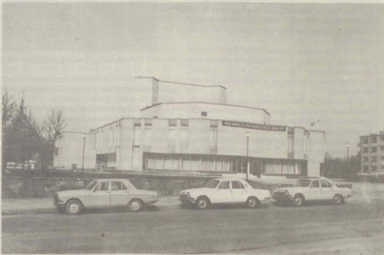
Anykščiuose pastatyti nauji kultūros rūmai.