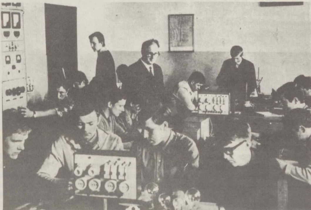
L. Ž. Ū. Akademijos studentai elektros laboratorinį darbą atliekant.

Daina ir linksma nuotaika visada lydėjo akademijos studentiją ir lydės.