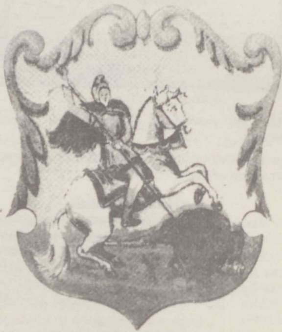
Senasis Marijampolės herbas su šv. Jurgiu

miestiečiai gali paduoti apeliaciją Kauno pavieto teismui;