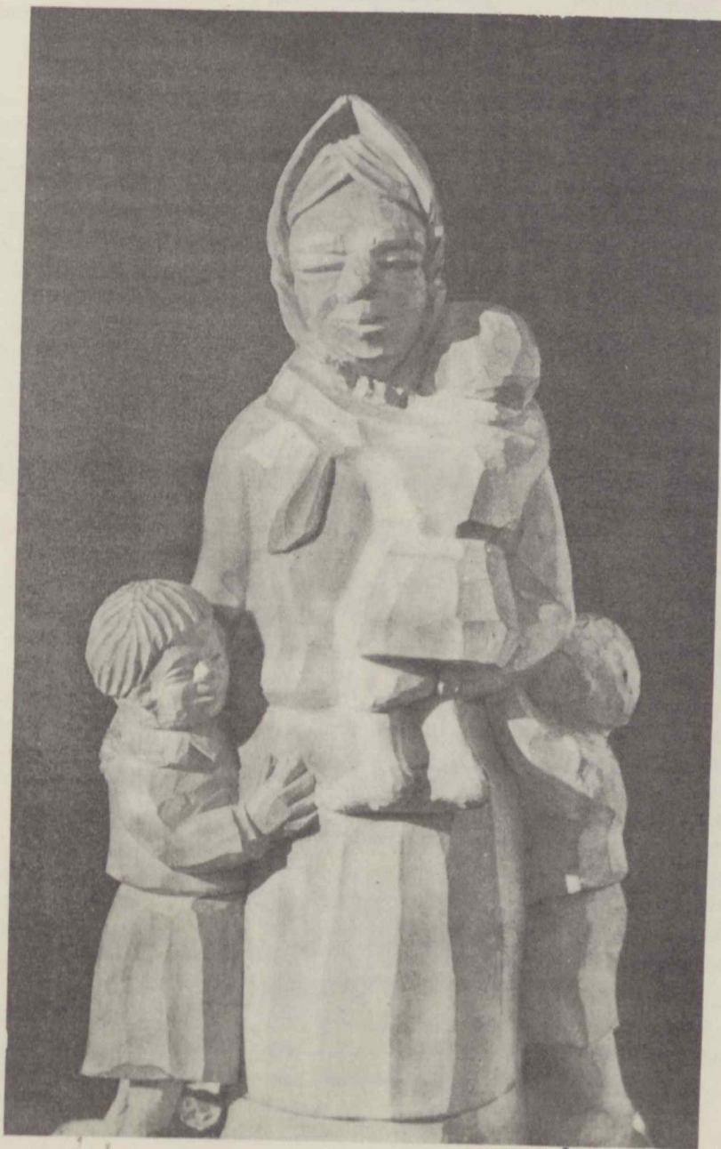
J. Lukauskas. Motinstė, medžio raižinys

NO. 2 BALANDIS – GEGUŽIS – BIRŽELIS, 1978 M.