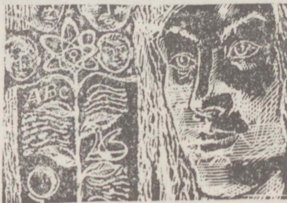
S. POVILAIČIO piešinys