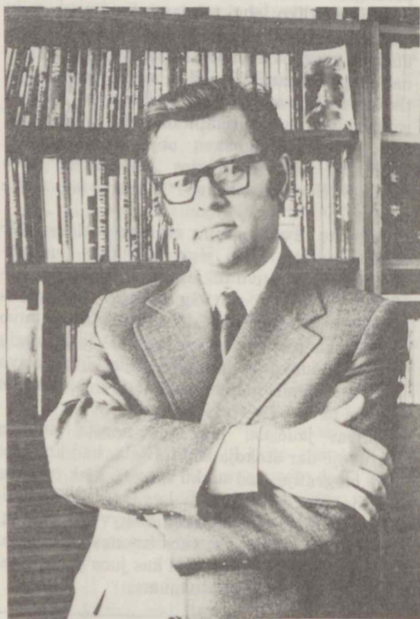
Rašytojas Vytautas Bubnys

Beveik prieš dvidešimt metų pasirodė pirmoji Vytauto Bubnio apysaka "Beržai svyruokliai," su vienu palankumu sutikta ir skaitytojų, ir profesionaliosios kritikos. Du intensyvaus kūrybinio darbo dešimtmečiai—beveik pusantros dešimties knygų. Kai kurios iš jų ne kartą išleistos pakartotinai, išverstos į lenkų, vokiečių, čekų, estų, latvių, rusų, kitų tarybinių tautų ir socialistinių šalių kalbas. Sėkmingai susiklostė autoriaus santykiai su kinematografija: jo apysakos "Arberonas" pagrindu pastatytas filmas "Mažoji išpažintis." Pagal jo romaną "Po vasaros dangum" susukta kino juosta "Perskeltas dangus" priklauso prie įdomiausių Lietuvos kino studijos darbų. Ekranizuojamas paskutinis rašytojo romanas.