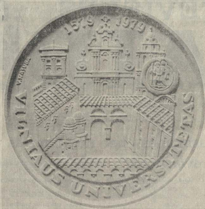
Vilniaus universiteto medalio pirmoji pusė