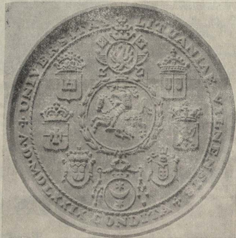
Vilniaus universiteto medalio antroji pusė

Redaguoja Redakcinė komisija. Vyr. redaktorius kun. Pr. Daukyns. Korespondencijas, straipsnius, skelbimus, prenumeratas siųsti viršuje nurodytu adresu. Prenumeratos kaina metams 15 dol. Kituose kraštuose 18 dol. Atskiras numeris - 30 centų. Skelbimai už skilties vieną cm $ 1. Nuolatiniams skelbėjams daroma nuolaida. Už skelbimų turinį neatsakoma. Redakcija straipsnius ir korespondencijas taiso savo nuožiūra.