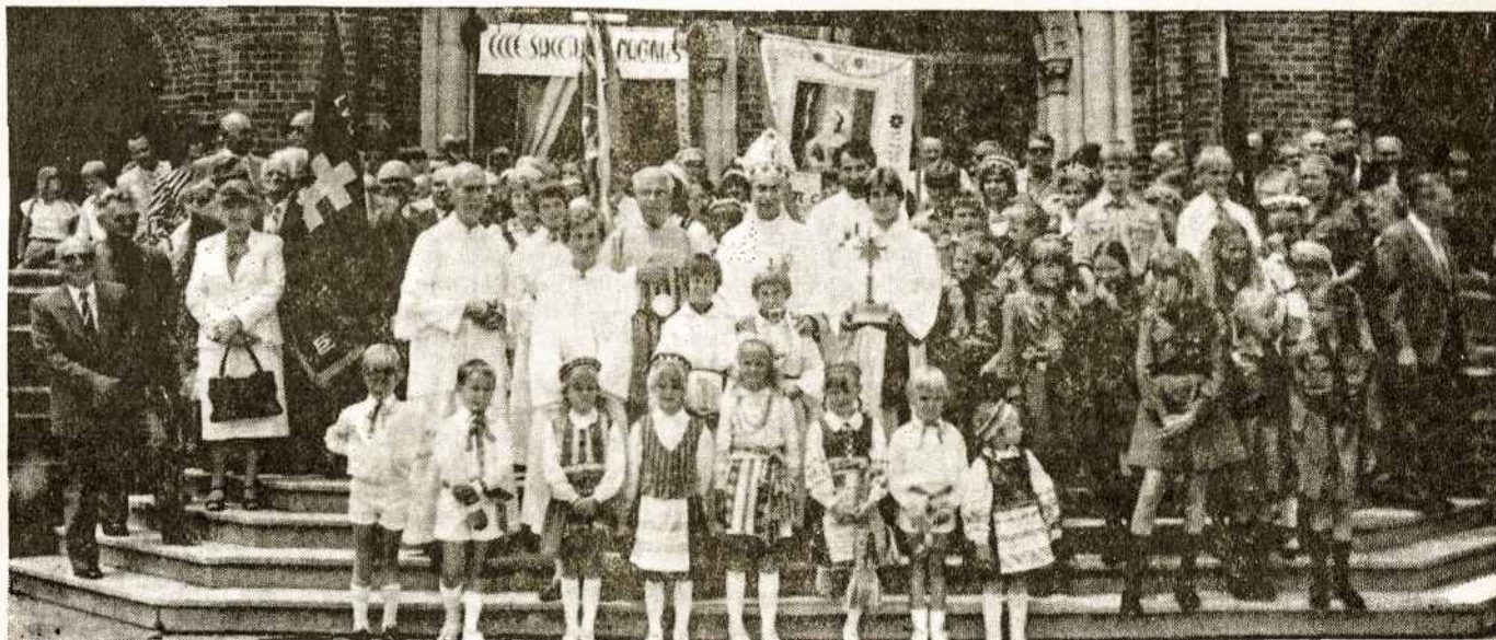
Sydnejuje po pamaldų minint šv. Kazimiero jubiliejų praeitais metais spalio 6 d., Dalyvavo svečias Apaštališkojo Sosto delegatas arkiv. Luigi Barbarito. Šios šventės aprašymas buvo praeitais metais Tėviškės Aidų Nr. 46.