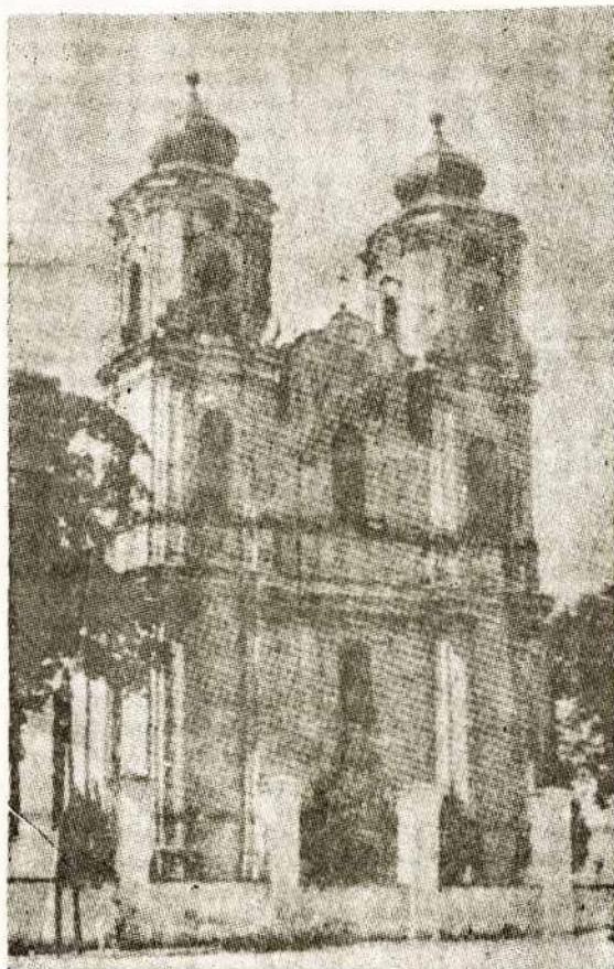
Seinų katedra, kurioje palaidotas vyskupas Antanas Baranauskas. Prie lenkų lietuviai nebegalėjo čia turėti savo pamaldų ir tik naujas vyskupas pernai spalio mėn. vėl jas leido turėti.

Kovo 4 sukaks 500 metų nuo Lietuvos jaunimo globėjo - šv. Kazimiero - mirties. Tą dieną lietuviai visame pasaulyje, ne tik Vakaruose, bet ir okupuotoje tėvynėje, prisimins savo šventąjį, kuris šviečia mūsų tautai bei mums padeda asmeniniuose gyvenimo rūpesčiuose.