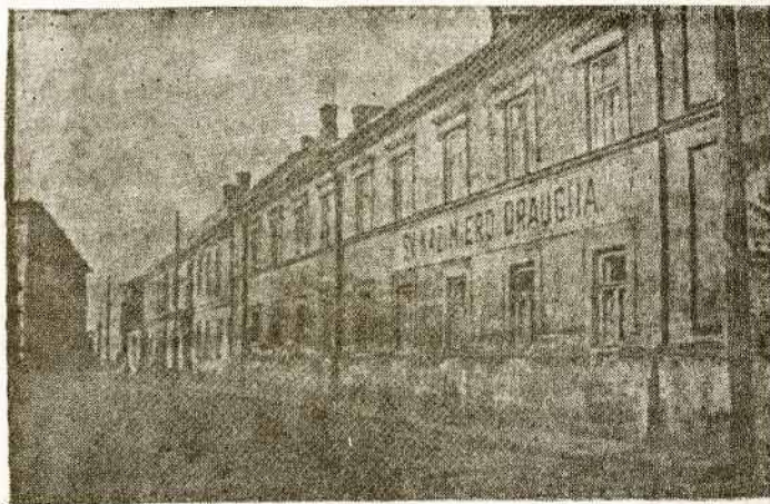
Šv. Kazimiero Draugijos rūmai Kaune.