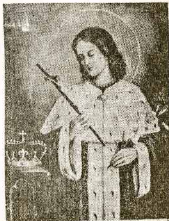
Šv. Kazimieras jėzuitų stiliumi

LITHUANIAN NATIONAL CATHOLIC M. MAŠVYDO BIBLIOTEKA