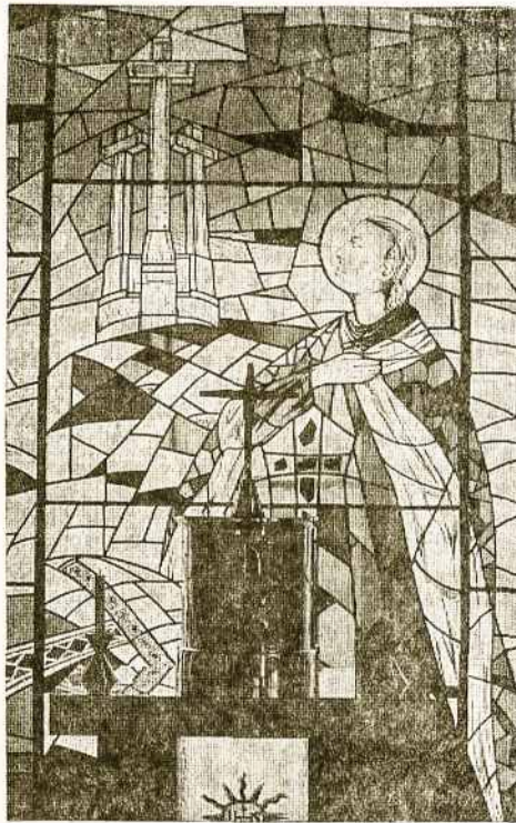
Šv. Kazimiero bažnyčios galinis vitražas. Piešinys dail. Ievos Pocienės

Šližio Tėvynės Globėjui. Giesmė savo melodija senoviška, bet skambėjo darniai.