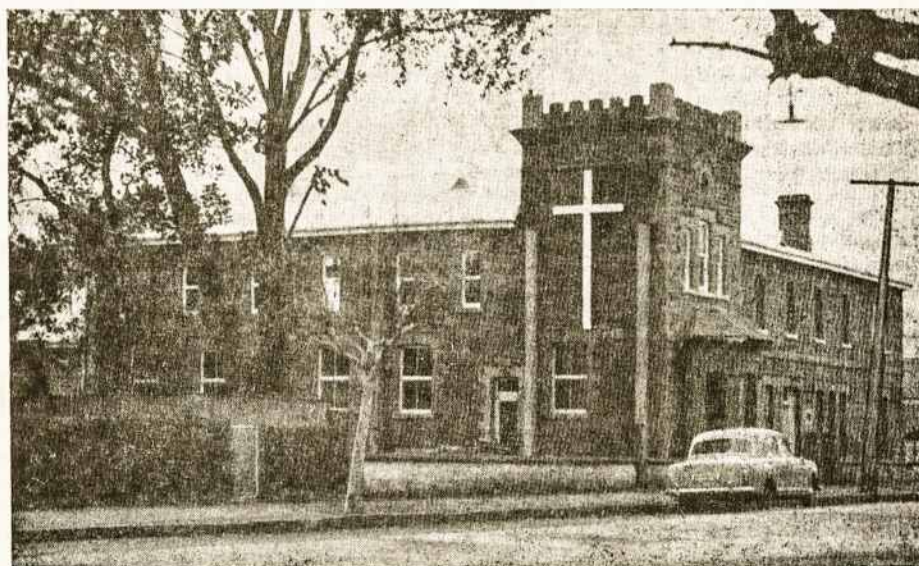
Šv. Kazimiero bažnyčia ir Katalikų Centras Adelaidėje