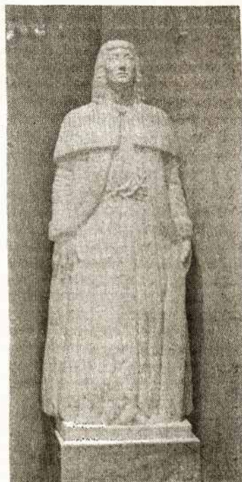
Šv. Kazimiero skulptūra Adelaidės lietuvių bažnyčioje.