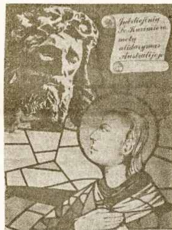
Šv. Kazimiero jubiliejaus minėjimo programos viršelis.