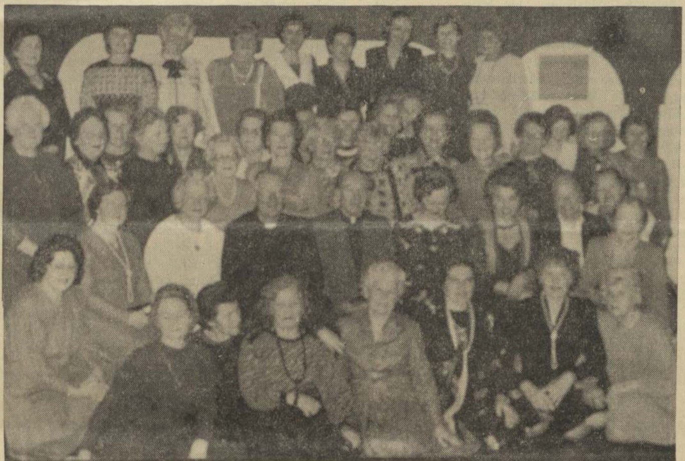
MELBOURNO LIETUVIŲ KATALIKIŲ MOTERŲ DRAUGIJA

= Ispanijos katalikų Bažnyčia ypatingu būdu pasižymi misijų veikla. Vien Madrido arkivyskupija yra pasiuntusi į misijų kraštus virš 1.700 misionierių. Daugiausia jų dabar dirba įvairiuose Pietų Amerikos kraštuose, kiti misionieriai dirba afrikoje ir Azijoje.