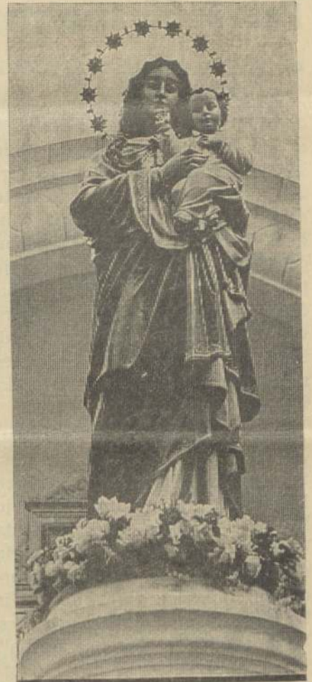
Sveika Marija, Šiluvos Mergele, Varge aplankius Lietuvos šalelę! Pamiltą Dievą sugrąžink. Nuo pikto priešo šalį gink!

Rugsėjo 8-toji yra Lietuvių Tautos Šventė, minima per Švč. Marijos Gimimą, nes tą dieną Vytautas Didysis 1430 m. buvo paskyręs vainikuotis karaliaus vainiku Vilniuje. Zigmantas Liuksemburgietis — vokiečių karalius ir imperatorius siuntė Vytautui karališkąjį vainiką, bet jo nesulaukė, pasienyje lenkams pavartojus smurtą. Vytauto Didžiojo žygiai ir pastangos, kad ir nebaigtos akivaizdžiu karaliaus vainiko užsidėjimu, ne mažiau darė gilaus išpūdzio vėlesnėms kartoms.