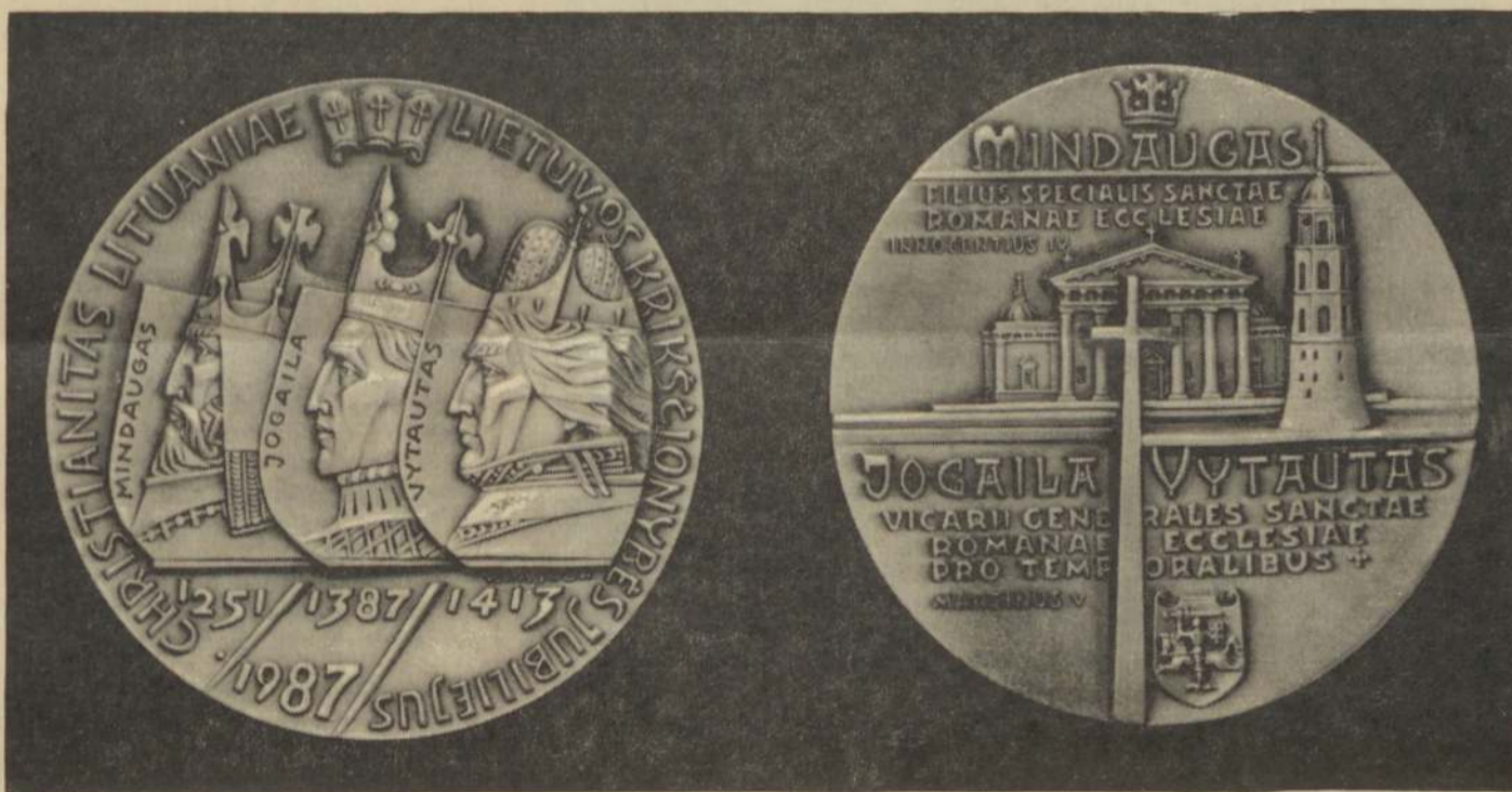
NUKALTAS LIETUVOS KRIKŠČIONYBĖS JUBILIEJAUS MEDALIS

Po pamaldų didžioji minia, vadovaujama vyskupo ir kunigų, kryžiaus kelio procesijoje pajudėjo į garsiuosius Žemaičių Kalvarijos kalnus. Tai jau sena tradicija. Žemaitis jaustūsi nebuves Kalvarijoje, jei grįžtų į namus, neapėjęs kalnų, neapmąstęs Kristaus kančios ir mirties už pasaulio išganyką. Šiomet maldininkų minioje ypač buvo gausu jaunimo. Per visas dienas čia išdalinta apie 25.000 komunijų. LRTV