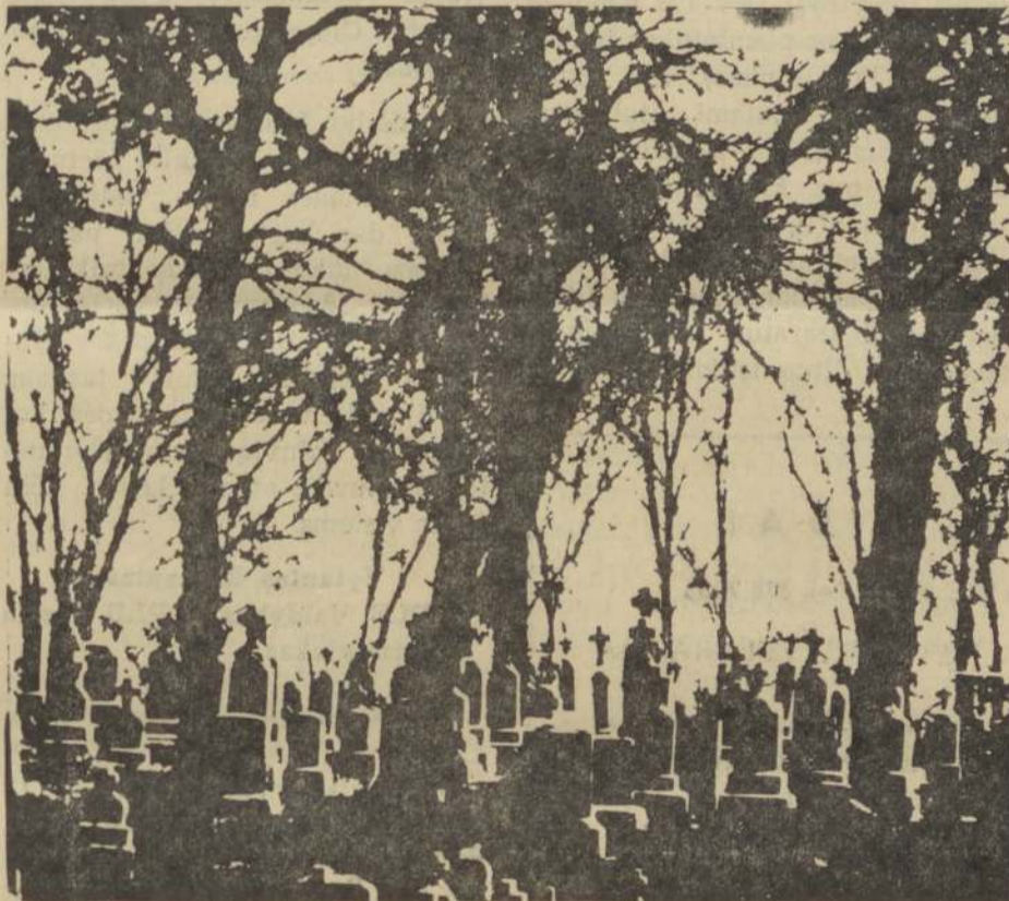
Jau daugelis mūsų ten iškeliavo. Prisiminkime juos Vėlinių proga.

Vargiai bus įmanomas ir centrinis minėjimas Vilniuje, nes valdžia jo "nepageidauja". Minėjimai tegalės įvykti labai kuklūs, parapijinėse bažnyčiose. Spaudoje rašoma, kad vis dėlto išleista šv. Rašto Naujojo testamento nauja laida, žinoma, labai mažu tiražu. Negalima būti išplatinti ir jubiliejinį leidinį. Vietoje jo kasmet (Nukelta į 2 psl.)