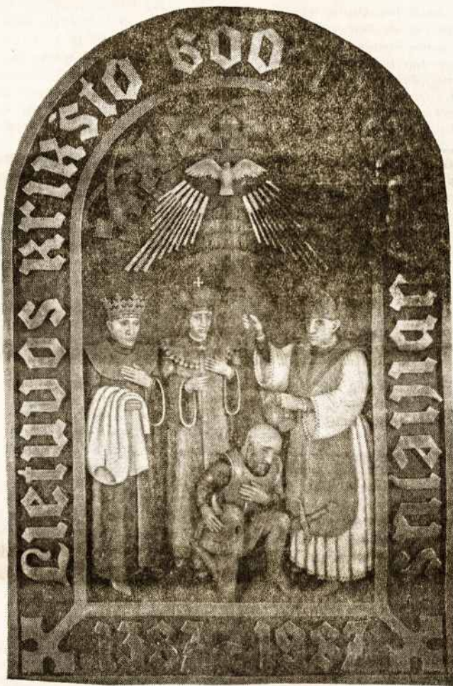
Lietuvos krikšto paveikslas, kuris kabo Telsių katedroje. Medžio drožinys, bet autorius nepažymėtas.