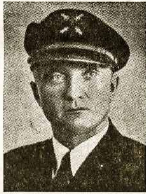
Kapt. Stepas Darius

Darius ir Girėnas savo testamente užrašė: "Lietuvių tauta laukia iš savo sūnų ir drąsniųjų žygių". Tokiu drąsiu žygiu jie įrašė savo vardus į Lietuvos istoriją. Tokių drąsiųjų žygių netrūksta mūsų broliams ir šiandien, kaip Romas Kalanta, Sibiro kankiniai. Tikėkime, kad mūsų tauta įveiks ir šių dienų audras.