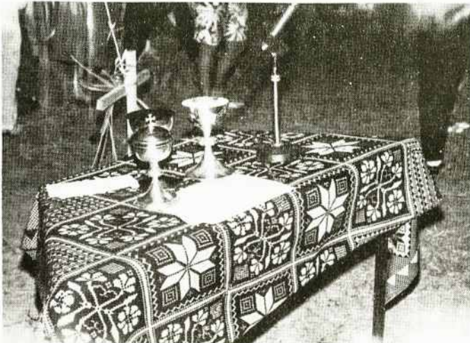
VI PLJ Kongreso Stovyklos altorius

Kas apie stovyklos gyvenimą gali geriau žinoti, jei ne stovyklos vadovas? Todėl tik atvažiuavusi į stovyklą tuoj pasistengiau "sugauti" vadovą. O vadovą tikrai reikia gaudyti, pilnoj to žodžio prasmė. Pamatei ateinantį, jau renki žodžius jo pasveikinimui ir...žiūrėk jau jo nebėra.