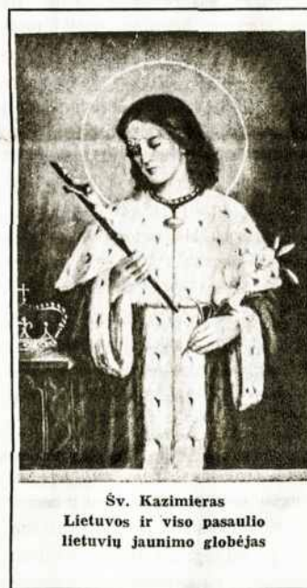
Šv. Kazimieras Lietuvos ir viso pasaulio lietuvių jaunimo globėjas