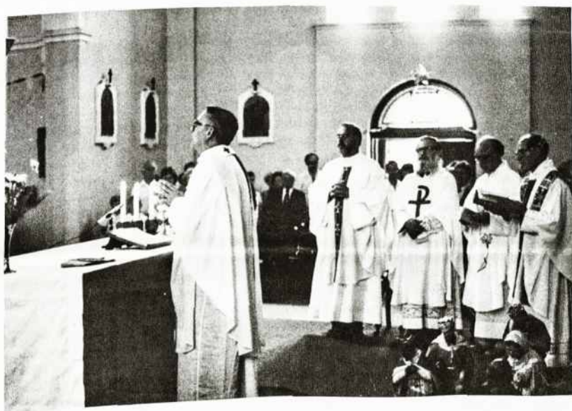
Uždarymo Mišios Melbourne