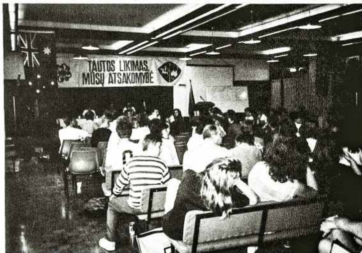
Studijų Dienos Canberroje