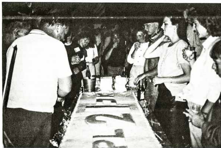
Stovykloje kongresų 21-o gimtadienio pyragas