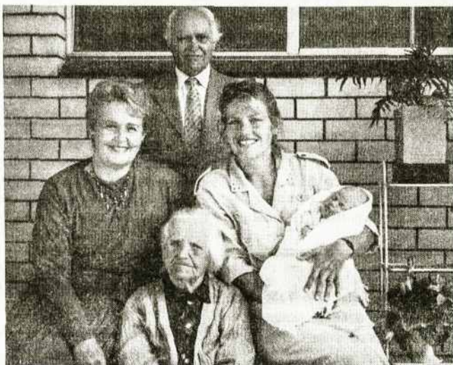
Penkios lietuvių generacijos Australijoje