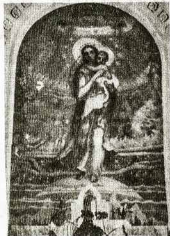
Klaipėdos Marijos Talkos Karalienės bažnyčios pagrindinė freska, 96 kvadratinį metrų ploto. Išplėšus iš katalikų bažnyčią, visos vidaus dekoracijos užteptos derva.