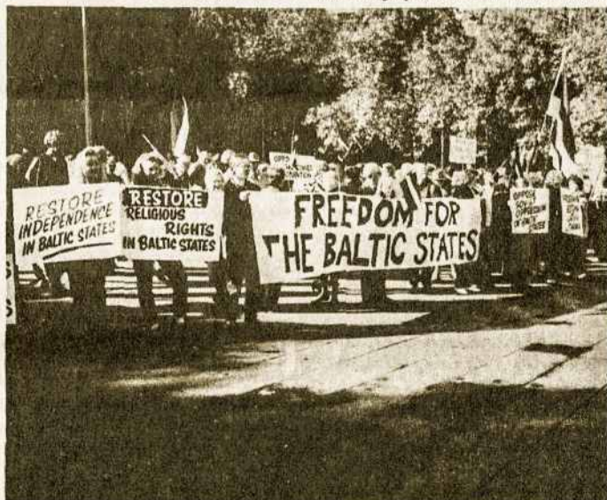
Pabaltiečių trėmimų demonstracija Melbourne City Square birželio 11 d. Praeliviams buvo dalinamos gerai paruoštos proklamacijos su Europos žemėlapiu, kviečiant remti Pabaltiečių Laisvės kovą.