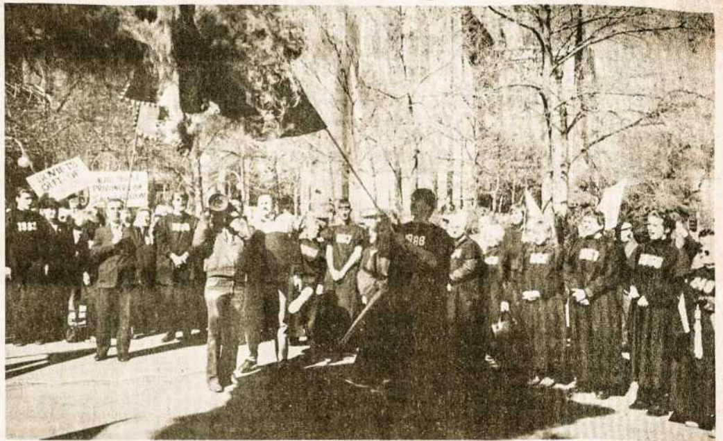
Latvių jaunimas degina sovietinę vėlavą. Kiekvienas jų vilkėjo ilgą juodą rūbą, o ant nugaros ir krūtinės išrašyti visi vergijos metai, pradedant 1940-aisiais.