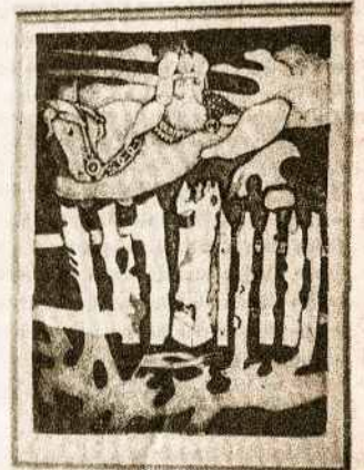
Gražina Didelytė. „Atminties vartai“. 1984. Ofortas, 20x15 cm

Paroda vyks Lietuvių namų antrame aukšte. Pradžia 10 val. ryto. Parodoje eksponuojami paveikslai bus parduodami.