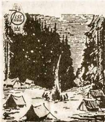
VII-JI TAUTINĖ STOVYKLA SEVEN RANGES SCOUT RESERVATION KENSINGTON, OHIO 1988 • VII 11 • 14-24

Didžiojo parado metu Australijos Rajono vėliava buvo nešama trečioje vietoje po Amerikos ir Lietuvos vėlavų.