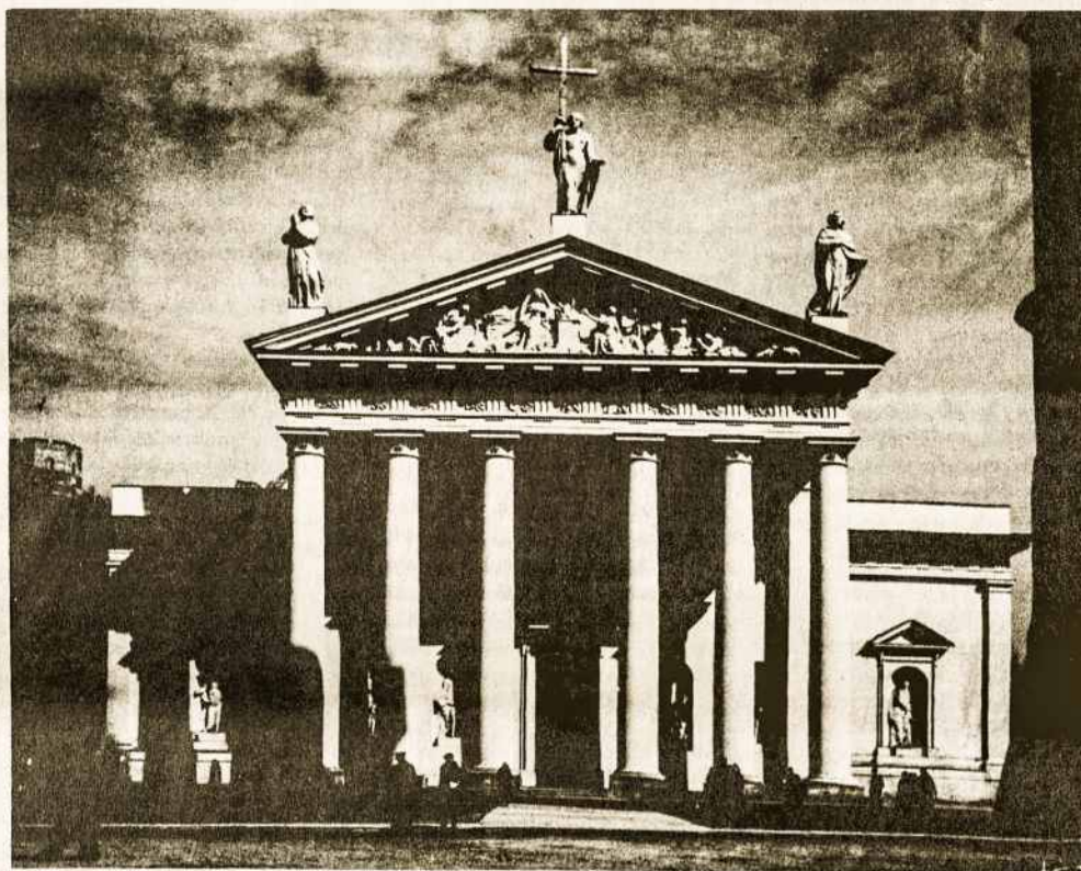
Vilniaus katedra 1940 m. Kairėje viršuje Gedimino pilies bokštas. Prie šoninių navų yra keletas koplyčių, didžiausia ir puošniausia šv. Kazimiero koplyčia. Okupacijos metais 1953 m. šv. Kazimiero palaikai buvo perkelti į šv. Petro ir Povilo bažnyčią Antakalnyje, o katedros priešakio šventųjų statulos buvo nuverstos, pati katedra 1956 m. paversta pavelkų galerija.