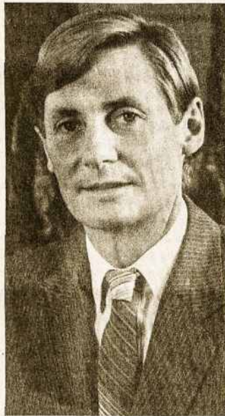
Pietų Australijos premjeras John Bannon, kuris atidarys Lietuvių Dienas Adelaidėje