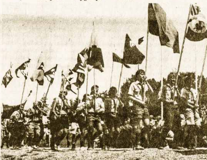
Didžiosios Lietuvos Kunigaikštystės atkurtos vėlavos parade tuoj po tautinių ir skautiškų vėlavų VII Tautinėje stovykloje.

Paradas labai išpūdingas, nes nešamos vėlavos - JAV, Lietuvos, Australijos rajono, daugelio tautų, Jūros skautų ir visokių vienetų. Akademines skautų KORPI VYTIS ir ASD nešamos priešais akad. skautų (apie 100 stovyklautojų) koloną, kurie tradiciniai žygiuoja po 3 (sesė-brolis-sesė). Svečiai visiems dalyviams kelia ovacijas. Nepamiršamas vaizdas - nešamų senovės Lietuvos karinių vėlavų kopijų gana didelio skaičiaus.