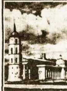
Vilniaus arkivyskupija II

LIETUVOS BAŽNYČIOS CHURCHES OF LITHUANIA