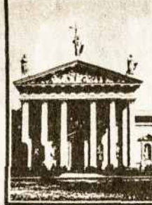
Vilniaus arkivyskupija I

LIETUVOS BAŽNYČIOS CHURCHES OF LITHUANIA