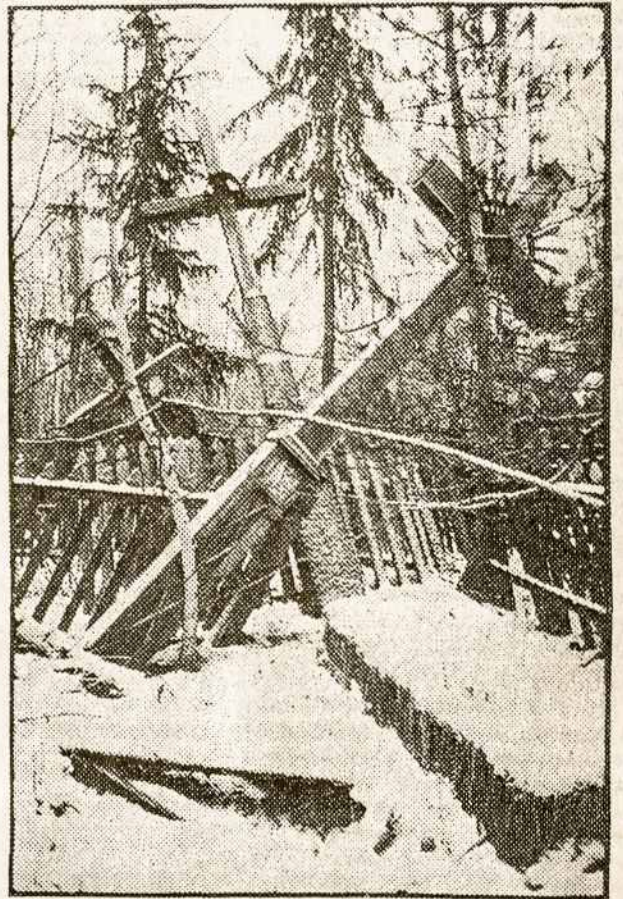
Kryžiai lietuvių tremtinių kapinėse Igarkoje - Staurės Sibire.