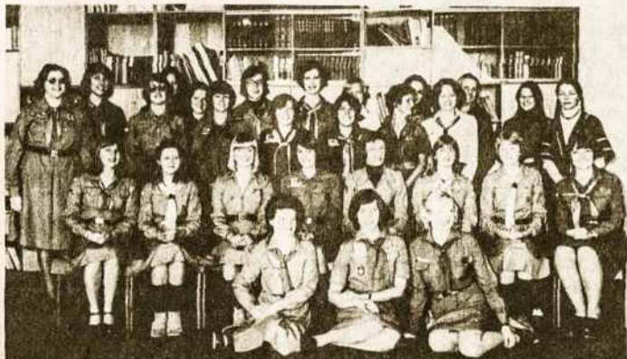
Melbourno Džlugo tunto vyresnės skautės 1978m. ruošiantis VI Tautinei stovyklai Gilwell Parke netoli Melbourn. Kurias atpažįstame po 10 metų?