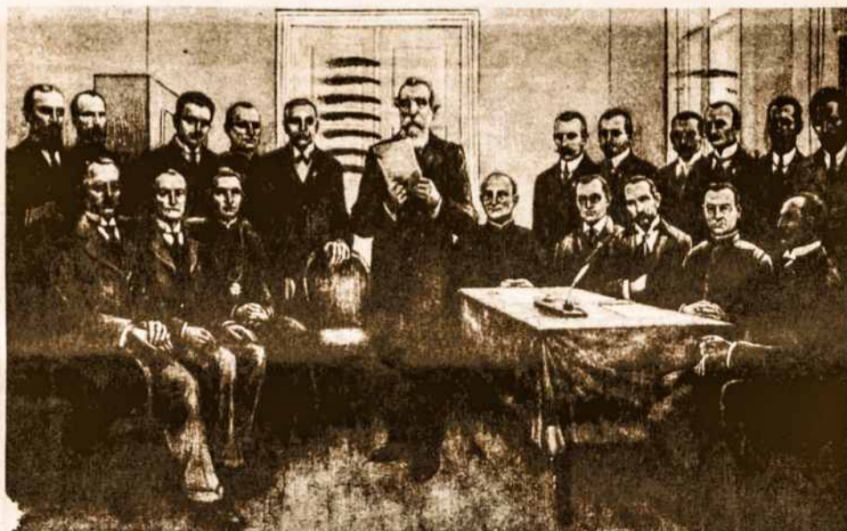
1918 m. vasario 16 d. Vilniuje dr. Jonas Basanavičius skelbia Nepriklausomos Lietuvos Atstatymo Aktą, kurį pasirašė Lietuvos Tarybos nariai.

Per 40 vergijos metų okupantas norėjo, kad lietuvių tauta pamirštų savo garbingą praeitį ir nusilenktų prieš Kremliaus stabus. Jie iš jaunimo bandydami atimti Dievą, norėjo iš jų širdžių išplėsti Tėvynės meilę, tačiau išėjo priešingai. Pereitų metų įvykiai ir masinės demonstracijos parodė, kad lietuvių tauta yra gyva ir nesiruošia mirti.