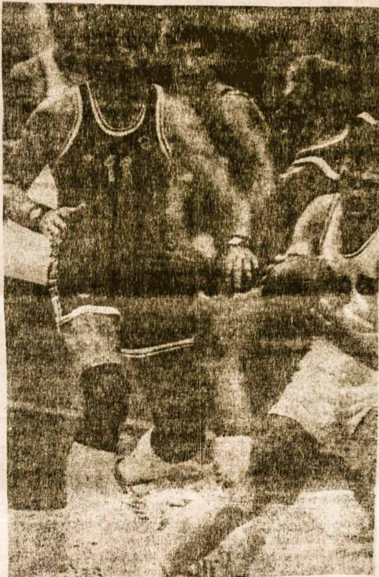
Arvydas Sabonis olimpinėse žaidynėse Seouli mieste, Sovietų Sąjungos krepšinio rinktinės varžybose su jugoslavais.