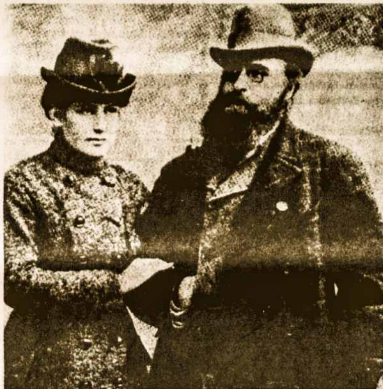
Prieš 100 metų, t.y. 1888 metais, dr. Jonas Basanavičius su žmona Bulgarijoje.