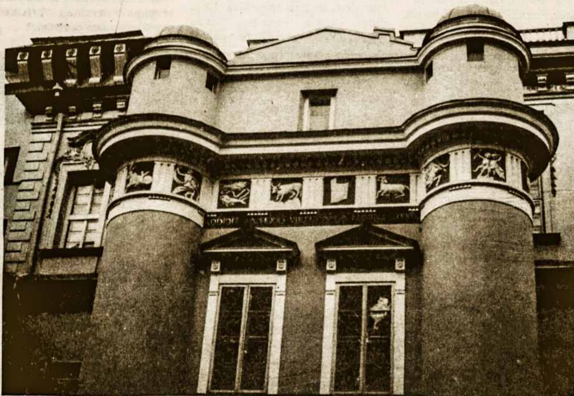
Vilniaus universiteto observatorijos pastatas