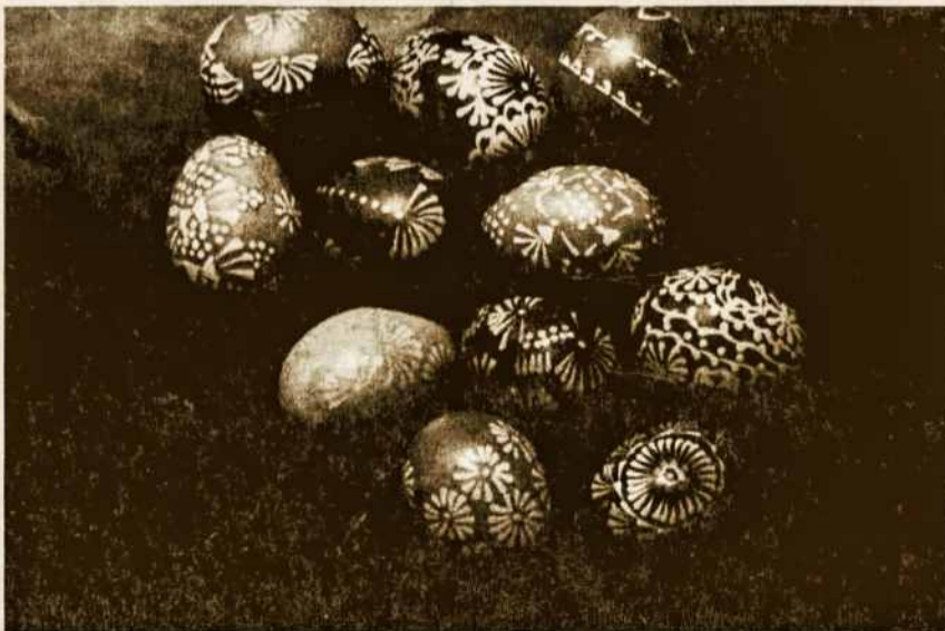
Cia - tik rašytiniai. O yra dar dažytiniai, keršūji, skutinėti bei išdinti margučiai.