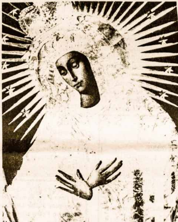
Stebuklingasis Aušros Vartų Dievo Motinos paveikslas

Ak, ilsėkis, ilsėkis ten Mama, Kadais šildžiusi man gimtą namą, Lai Tau šviečia Dangaus palaima, O mane žemė glaus-svetima.