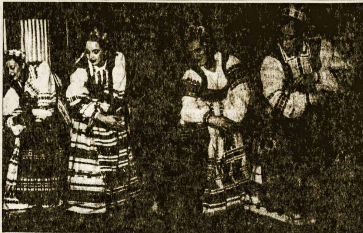
Gintarietės pavasariniam koncerte balandžio 16 d. Anapilyje atlieka šokį „Linėljai“