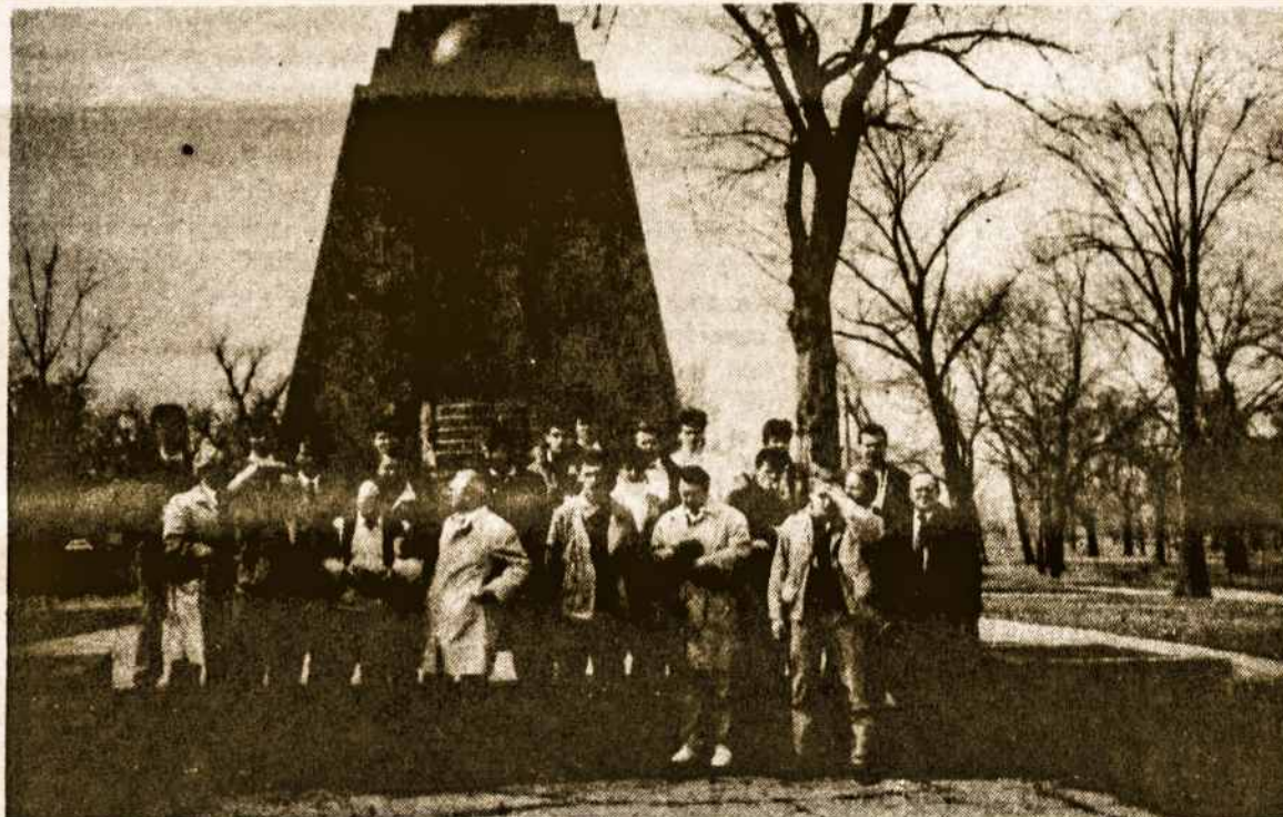
Vilniaus „Žalgirio“ jaunių futbolo komandos žaidėjai prie Dariaus Girėno paminklo Marquette Parke.

Visiems aukojusiems nuoširdžiai dėkoja ALK Federacijos Valdyba.