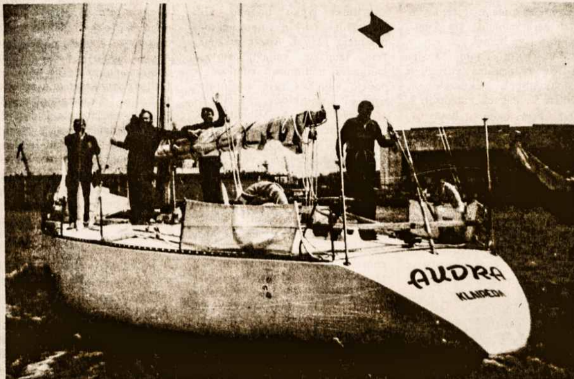
„Audros“ įgula pasiruošusi perplaukti Atlantą