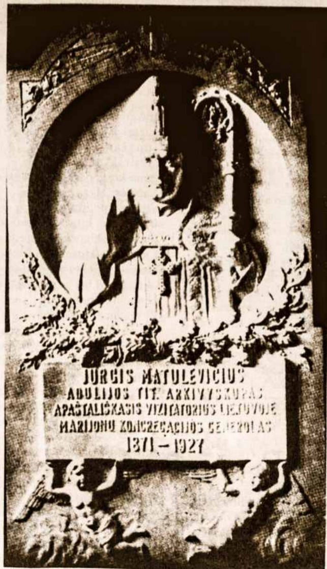
Palaim. Jurgio Matulaičio sarkofagas Marijampolės bažnyčioje.